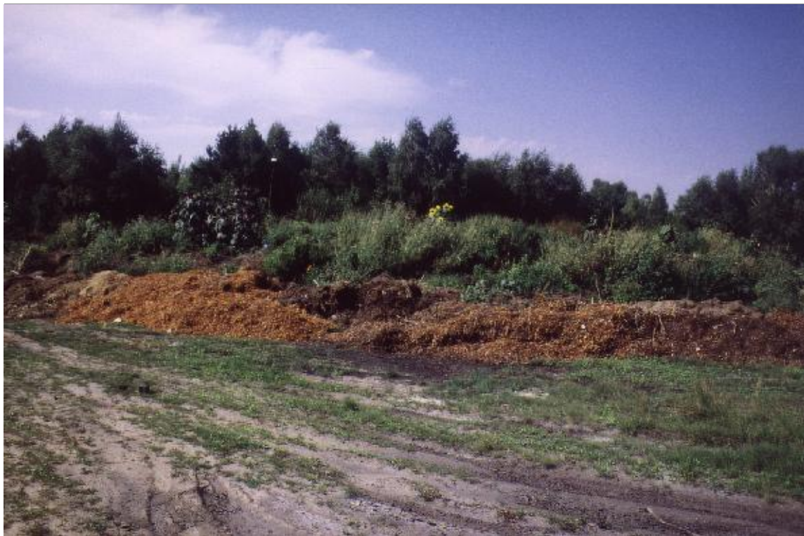
Abb. 1: Halden mit organischem Abfall und Ruderalbereichen