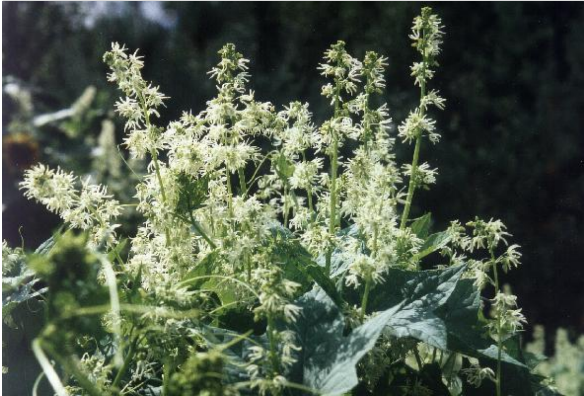
1. Bestand der Gelappten Stachelgurke ( Echinocystis lobata )