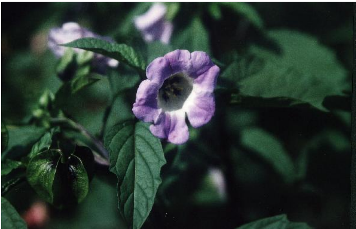
2. Giftbeere ( Nicandra physalodes )