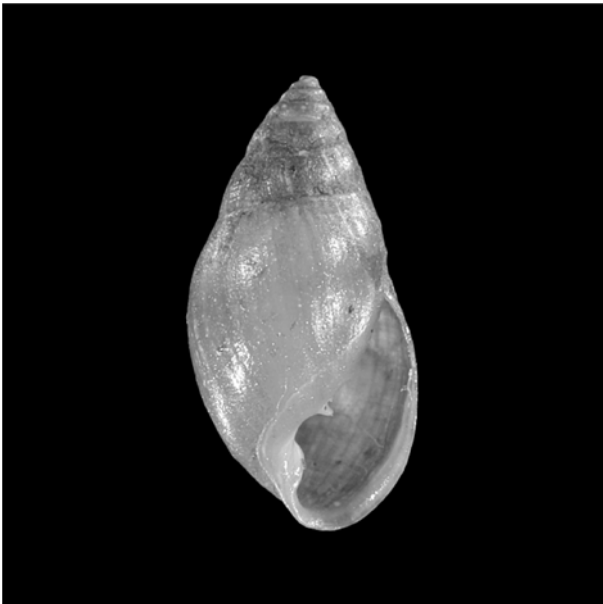
Abb. 5: Mäuseöhrchen ( Myosotella myosotis ), Foto: P. Glöer

der deutschen Meeresküsten (RACHOR 1998) ist Alderia modesta in die Kategorie 3 (gefährdet) eingestuft. In die gleiche Kategorie wurde die Art von GOSSELCK et al. (1996) für die mecklenburg-vorpommersche Küste eingestuft. Nach Recherchen des Instituts für Ostseeforschung gibt es allerdings keine Funddaten aus den vergangenen Jahrzehnten, so dass Alderia modesta eigentlich für Mecklenburg-Vorpommern hätte als verschollen gelten müssen (mdl. Mitt. Zettler). Von SCHLESCH (1937) existieren die einzigen, wenn auch ungenauen Daten: Warnemünde und Kadetrinne bis Rügen. Aus der Kieler Bucht (Schlei-Ästuar) liegen dagegen gesicherte Fundangaben vor (z.B. Jaeckel 1951). Wahrscheinlich ist Alderia modesta seltener als bisher angenommen. Der Bestand dieser nur bis maximal 1cm langen Meeresnachtschnecke ist durch Störungen der Ästuarlebensräume bedroht.