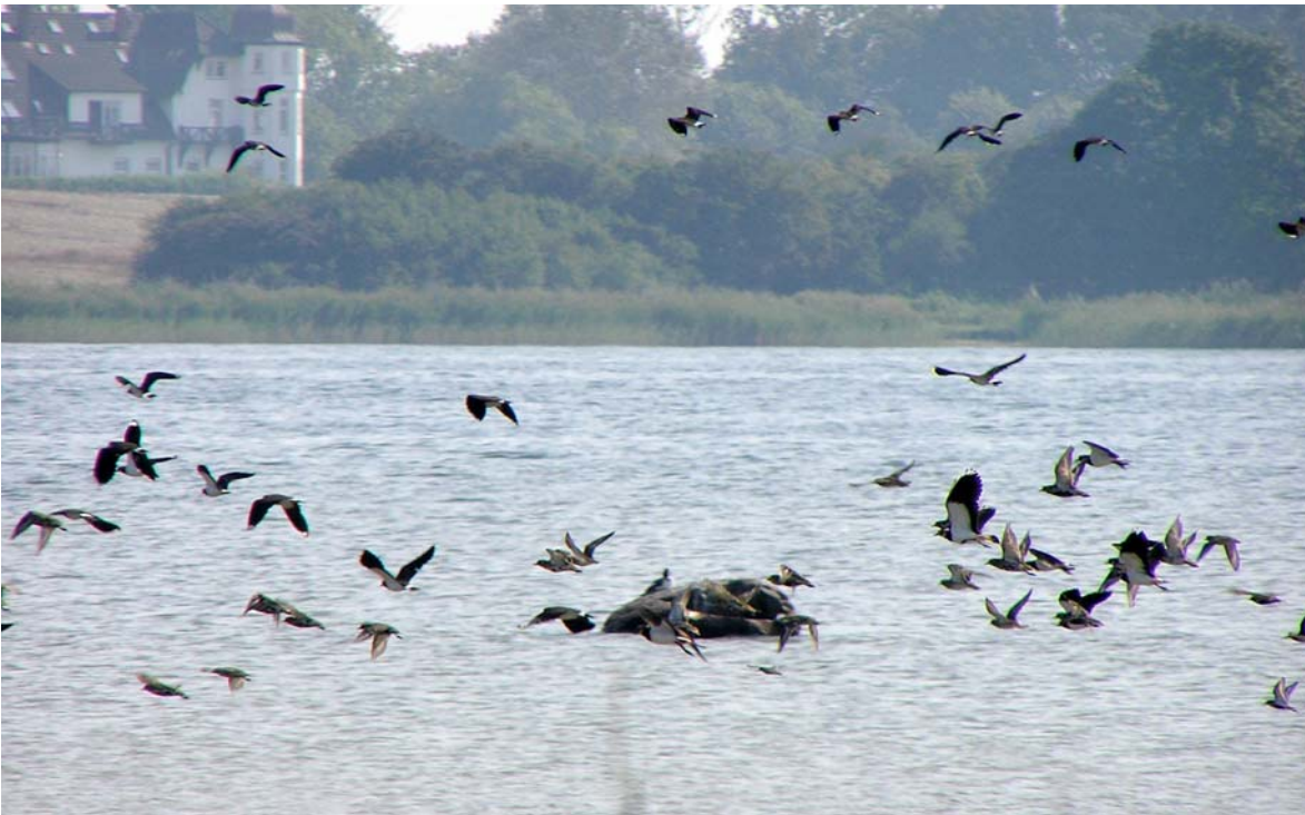
Abb. 4: Kiebitze ( Vanellus vanellus ) und Goldregenpfeifer ( Pluvialis apricaria ) am Breitling auf Poel

Mancher konnte so seine Artkenntnisse aufbessern oder die schwierigen Kunst der Limikolen-Bestimmung vertiefen.