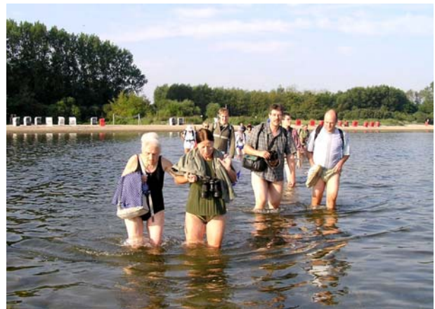
Abb. 1: Die Exkursionsteilnehmer auf dem Weg zur Vogelschutzinsel Langenwerder.