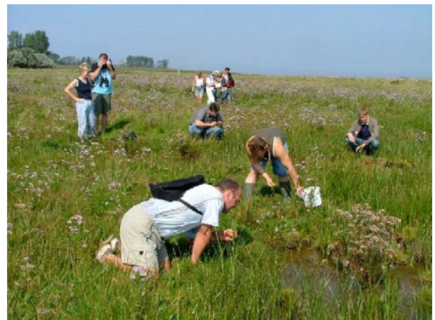
Abb. 2: Auf der Suche nach dem Mäuseöhrchen in den Salzwiesen bei Vorwerk.