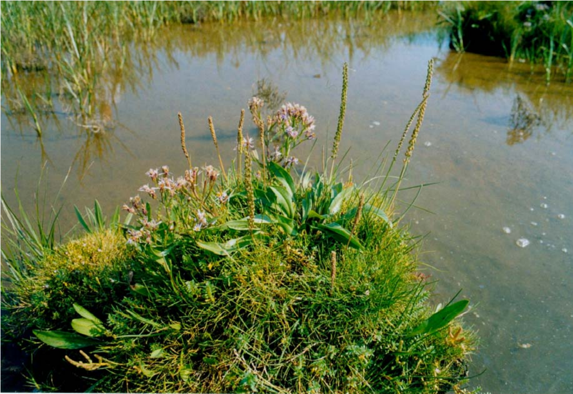
Abb. 3: Strandaster ( Aster tripolium ) und Strand-Dreizack ( Triglochin maritimum ) bei Vorwerk.