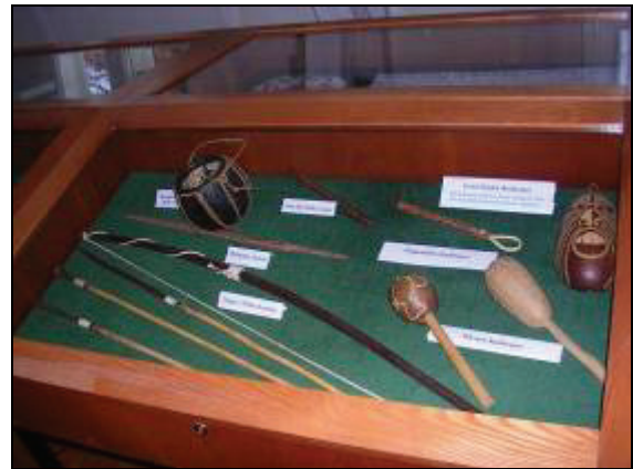
Abb. 6: Jagd- und Gebrauchsgegenstände der Indianer Paraguays

Etikettierung. Durch den Rotary-Club Ludwigslust wurden drei Standvitrinen gespendet (siehe unten – Sachspenden), von denen zwei im Zoologieraum und eine im Sonderausstellungsraum Platz gefunden haben.