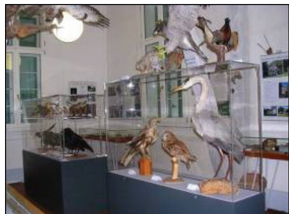
Abb. 11: Neue Vitrinen im Zoologieraum – vom Rotary-Club Ludwigslust gespendet