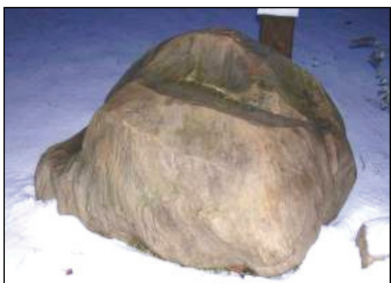
Abb. 13: Der gleiche Windkanter - jetzt im Natureum.