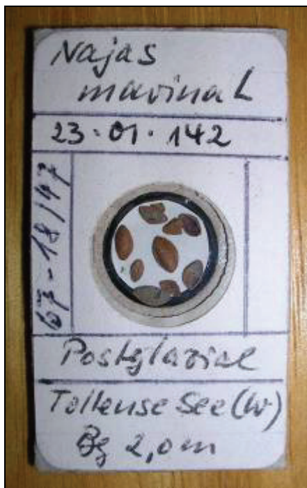
Abb. 8: subfossile Früchte des Nixkrautes aus einer Bohrung, 1967, Coll. G. Krille

Sowohl in den botanischen als auch den zoologischen Sammlungen werden für 2010 zahlreiche Neuzugänge erwartet (z.B. Moose, Pilze, Egel, Insekten und Mollusken).