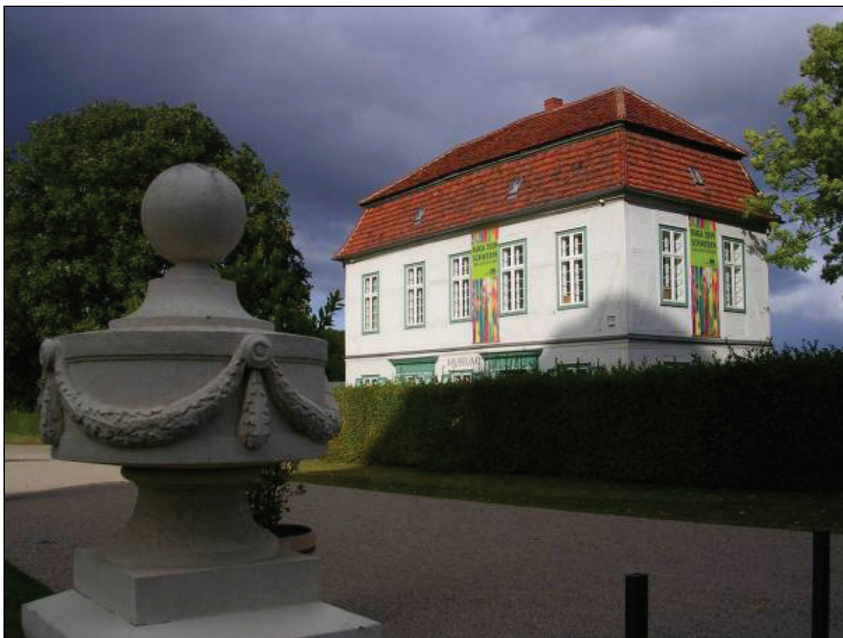
Abb. 1: Das Natureum mit BUGA-Werbung im Sommer 2009

Im Jahr 2009 wurden insgesamt 13 Vorträge und 4 Exkursionen durch die NGM angeboten, vorrangig im Rahmen der monatlichen Museumsabende. Zur Tradition wurden dabei die Mai-Exkursion, die „Kleine Welt am Wegesrand“ sowie die Pilzexkursion in den Schlosspark Ludwigslust als Vorbereitung zur Pilzausstellung. Ein Vortrag konnte während der Kunst- und Kulturnacht am 12. September angeboten werden. Da es aber wiederum bereits im Vorfeld zu Überschneidungen mit anderen Veranstaltungen (Rockkonzert hinter dem Schloss) kam und diese nicht koordiniert werden konnten sowie eine Namensänderung von „Kunst- und Museumsnacht“ in „Kunst- und Kulturnacht“ erfolgte, wird sich das Natureum 2010 nicht mehr daran beteiligen.