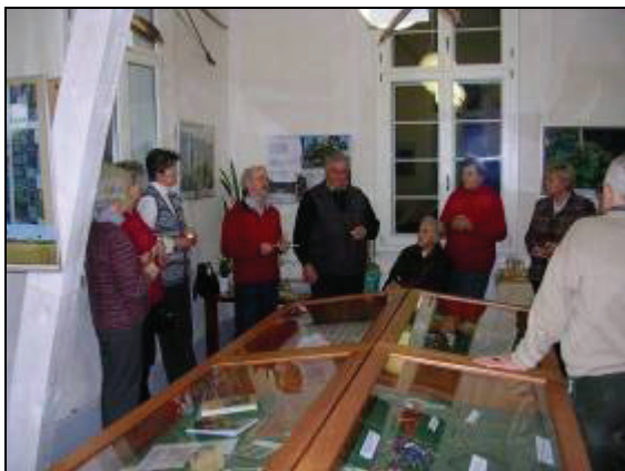
Abb. 5: Eröffnung der Sonderausstellung „Ureinwohner der Welt heute – Hilfe beim Überlebenskampf der Naturvölker“