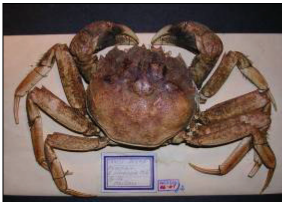
Abb. 9: Wollhandkrabbe, Meißen 1946