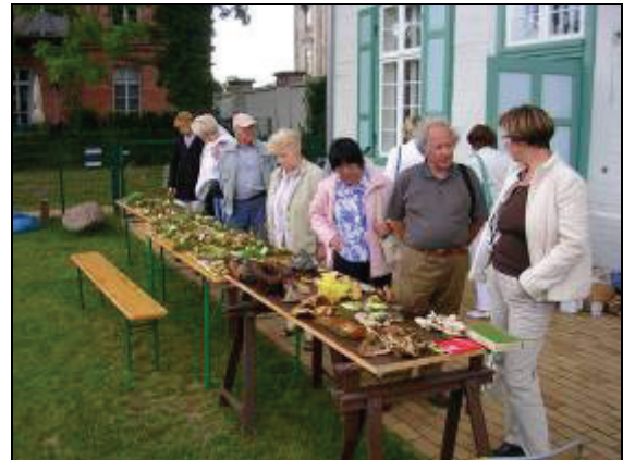
Abb. 7: Pilzausstellung am 29.08.2009