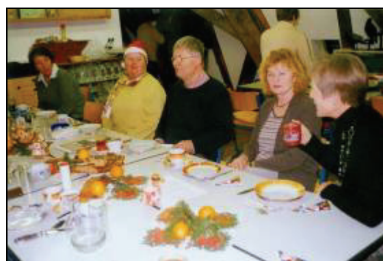
Abb. 3: Weihnachtsfeier der Botanik-Fachgruppe des Landkreises Ludwigslust

„Eine Stadt liest ein Buch“ war eine literarischen Aktion, die vom Börsenverein des Deutschen Buchhandels/Region Norddeutschland initiiert wurde und an der auch die Stadt Ludwigslust teilnahm. In einer gemeinsamen Lesung der Vereine Seniorenverband BRH Ludwigslust, BarockLust und NGM im Goldenen Saal des Schlosses Ludwigslust las Hartmut Brun aus dem Buch „Ludwigslust – ein Lesebuch“, dessen Herausgeber er ist.