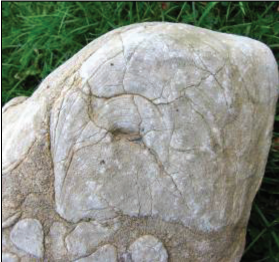
Abb. 3: Vergrößerter Ausschnitt des Girvanellenkalkes aus Meschendorf (Ostsee) mit Stomatoporen

Die kalkbildenden biogenen Teppiche umkrusteten dabei den vorhandenen Untergrund in zahlreichen übereinander liegenden Lagen.