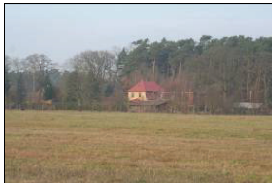
Abb. 1: Offene Landschaft in Jasnitz, wo das Wiedehopf-Pärchen wiederholt im April und Mai 2006 beobachtet wurde.