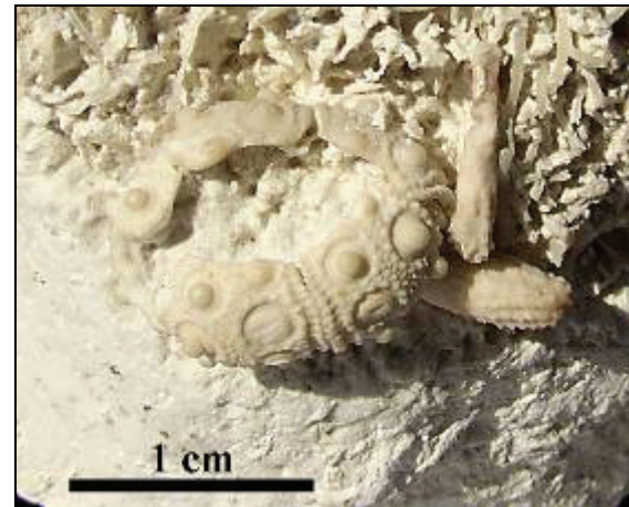
Abb. 5: Tylocidaris oedumi aus dem Bryozoenkalk, Unteres Dan, Sangstrup Klint, Djursland, Dänemark, Foto: Søren Bo Andersen