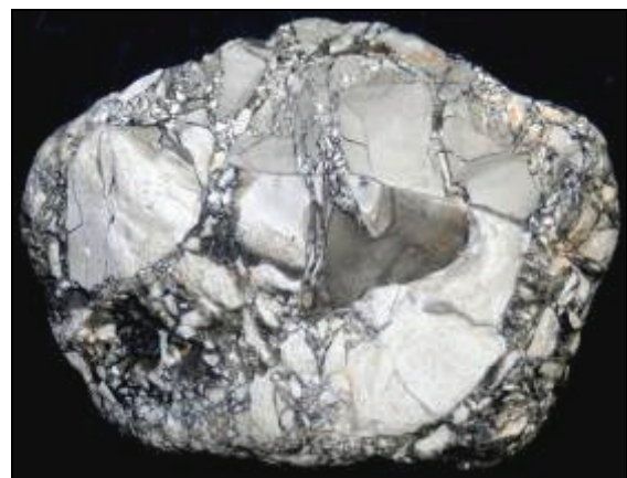
Abb. 1: Vorderseite der Feuerstein-Brekzie von Basedow b. Malchin, Größe: 10,5x8x6cm, Sammlung: W. Zessin, Jasnitz, später Natureum am Schloss Ludwigslust.

Feuerstein-Brekzien gehören bei uns zu den eher seltenen Funden. In Dänemark, Nordjütland, scheinen sie etwas häufiger vorzukommen. Selbst Sammler, die um diese Seltenheit wissen, brauchen lange, bis sie einen eigenen Fund aus Norddeutschland vorweisen können. So ging es auch mir bis zum 25. September 2010.