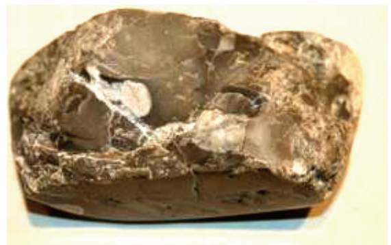
Abb. 6: Rückseite der polierten Feuerstein-Brekzie aus dem Kieswerk Pinnow b. Schwerin, Sammlung Geologisches Museum Braasch, Raben Steinfeld

Die Kiesgrube Basedow bei Malchin ist bekannt für ihre relativ große Anzahl von Jura-Geschieben, vornehmlich aus Dogger, sehr vereinzelt auch aus dem Malm.