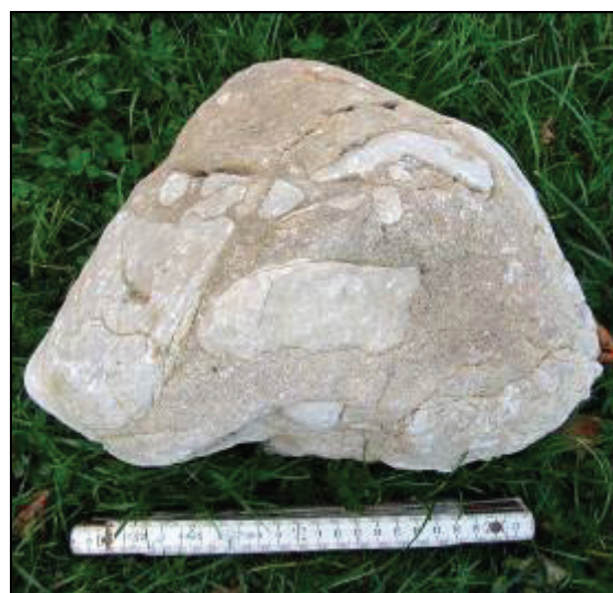
Abb. 2: Girvanellenkalk aus Meschendorf (Ostsee)

Stromatoporen sind eine Tiergruppe, ähnlich den Schwämmen, die koloniebildend lebten.