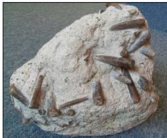
Abb. 1: Kreidezeitliches Geschiebe von Tarzow bei Wismar (35x30x16cm) mit 40 Belemniten der Art Belemnella occidentalis

Im Oktober 2006 fand ich ein großes, bemerkenswertes kreidezeitliches Geschiebe (Abb. 1) in der Kiesgrube Tarzow bei Wismar, Mecklenburg, das hier vorgestellt wird. Allein die hohe Anzahl von Belemnitenrostern der Art Belemnella occidentalis machte dieses Stück interessant. Nun sind Belemniten in der oberen Kreide, z.B. auf der Insel Rügen, keineswegs seltene Fossilien, ein Geschiebe in West-Mecklenburg mit dieser Anhäufung ist es aber.