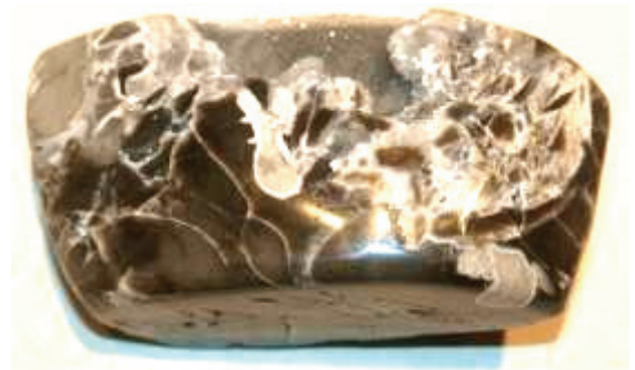
Abb. 5: Polierte Feuerstein-Brekzie von Pinnow b. Schwerin, Größe: 10x6x4cm, Sammlung Geologisches Museum Braasch, Raben Steinfeld