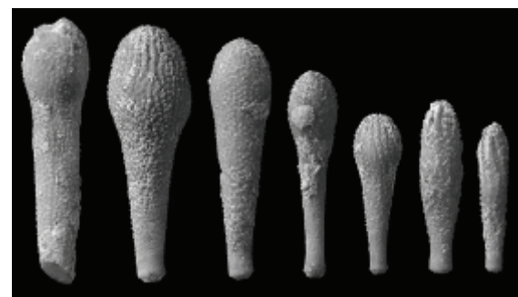
Abb. 6: Stachel von Tylocidaris oedumi aus der Kalkgrube Karlstrup, Unteres Dan, der längste Stachel misst 3cm Länge