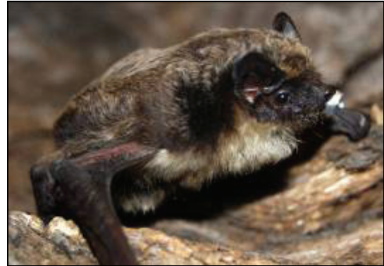
Abb. 2: Porträt der Zweifarbfledermaus ( Vespertilio murinus ) in Schwerin

Meldung an den Autor weiter gab. 30 Minuten später konnte die Fledermaus geborgen werden.