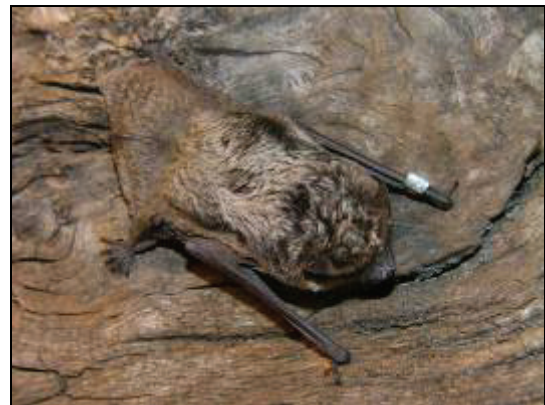
Abb. 3: Zweifarbfledermaus ( Vespertilio murinus ) in Schwerin

Es handelte sich um eine Zweifarbfledermaus. Hier stellte sich die Frage, woher während dieser Jahreszeit das Tier kam, und wie damit umgegangen werden sollte. Aufgrund der Witterungsverhältnisse und des Gewichtes von nur 7,4g erfolgte bis zum 19.3.2010 eine Ernährung mit Mehlwürmern im Fledermausterrarium. Nach der Beringung (B 95693) und aufgrund der günstigen warmen Witterung erfolgte unter Kontrolle die Auswilderung in einem Fledermauskasten FS1. Gegen 22:50 Uhr hatte die Fledermaus den Kasten verlassen.