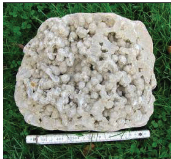
Abb. 1: Devonischer Kugelsandstein aus Zarrentin