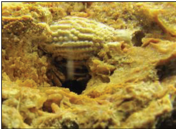
Abb. 7: Ockergelber Hornstein mit Stachel eines Seeigels der Art Tylocidaris oedumi . Fundort unbekannt. Sammlung D. Pittermann, Zittow

Herrn Pittermann beim Aufschlagen eines ockergelben Hornsteins unbekannter Herkunft (vermutlich aber Schleswig-Holstein, evtl. Groß Pampau) entdeckt. Leider ist zur Herkunft dieses Ockergelben Hornsteins und auch zum Sammler nicht viel bekannt geworden, lediglich, dass er wohl zumeist um Hamburg sammelte. Das Stück, aus dem die beiden abgebildeten Seeigelstachel kommen, lag in einer Kiste mit Steinen, die weggeworfen werden sollte.