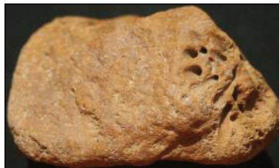
Abb. 1: Ockergelber Hornstein mit Abdruck eines Seeigels ( Tylocidaris oedumi ) von Lüttow, Leg.: K. Deppermann, Ratzeburg, Sammlung: Natureum am Schloss Ludwigslust.

Nachdem in letzter Zeit die Aufmerksamkeit der norddeutschen Sammler vermehrt auf den seltenen Ockergelben Hornstein gelenkt wurde (ZESSIN, 2009), konnten neue Funde nicht ausbleiben. Einige der Neufunde ließen die Bestimmung von Makrofossilien mit hohem Leitcharakter zu, die die Datierung in das Untere Dan zulassen. Insbesondere ein Fund aus der Kiesgrube Lüttow bei Zarrentin zeigt den Abdruck eines Seeigels der Art Tylocidaris oedumi Brünnich-Nielsen, 1938 mit den charakteristischen leicht keulenförmigen Stacheln.