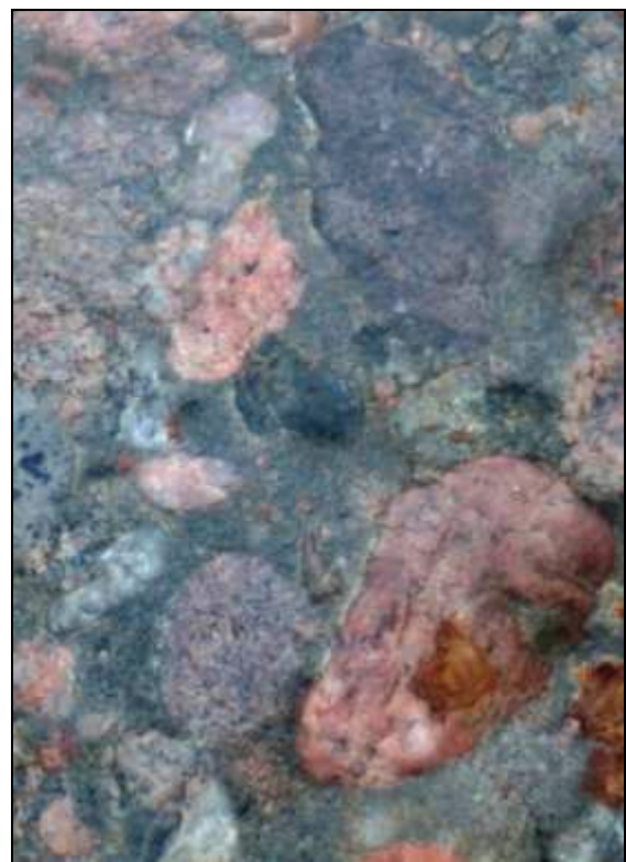
Abb. 2: Vergrößerter Ausschnitt des präkambrischen Konglomerates mit milchigen Quarzen und Graniten

Das Stück wird künftig in der Sammlung des „Natureums am Schloss Ludwigslust“ aufbewahrt werden.