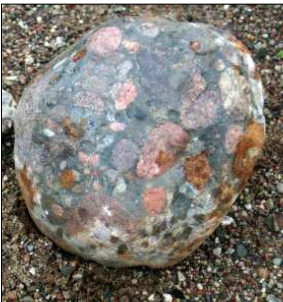
Abb. 1: Präkambrisches Konglomerat aus der Kiesgrube Langhagen, Größe: 30x25x15cm

Anlässlich einer Exkursion nach Basedow am 25.9.2010 wurde auf der Rückfahrt ein kurzer Abstecher in die Kiesgrube bei Langhagen gemacht. Dort fand ich ein interessantes Konglomerat (Abb. 1), das in einem eiszeitlichen Gletschertopf seine Form als Rotationsellipsoid bekommen hatte.