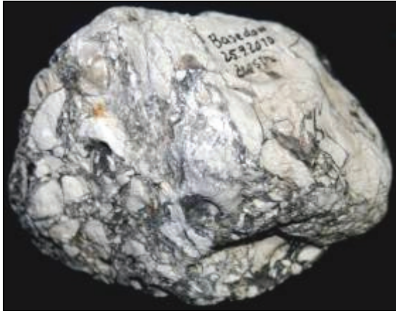
Abb. 2: Rückseite der Feuerstein-Brekzie von Basedow b. Malchin, Größe: 10,5x8x6cm, Sammlung: W. Zessin, Jasnitz.