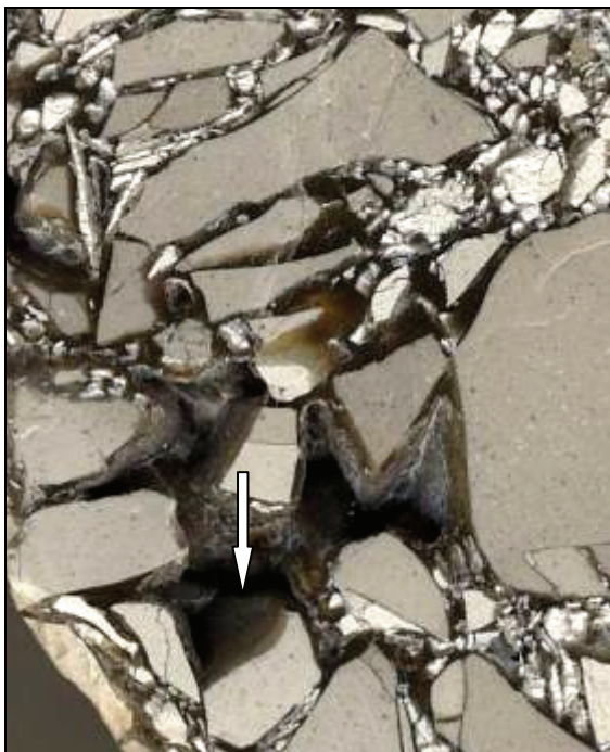
Abb. 3: Ausschnitt der Feuerstein-Brekzie von Basedow b. Malchin, Ausschnittsbreite 2,5cm, Hohlräume (Pfeil) mit blasig ausgebildeter Oberfläche des \text{SiO}_2 .

Eine weitere Feuerstein-Brekzie (Abb. 5 und 6) fand Herr Reinhard Braasch aus Raben Steinfeld, Mecklenburg, in der Kiesgrube Pinnow bei Schwerin bereits Anfang der 90er Jahre.