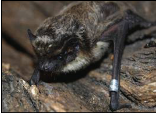
Abb. 1: Beringte Zweifarbfledermaus ( Vespertilio murinus ) in Schwerin

Weder durch Netzfang noch mit dem BAT-Detektor gelingen in der Regel Nachweise dieser Art. Eine Ursache dafür kann darin gesehen werden, dass sie relativ leise im Ultraschallbereich bei 25 – 27 kHz ruft. Viele Funde sind zufällig.