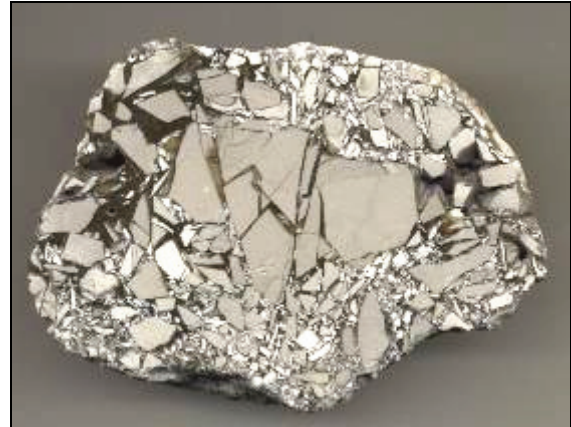
Abb. 4: Feuerstein-Brekzie von Basedow b. Malchin, geschnitten und poliert, die weißen Partien sind nicht vollständig verkieselt