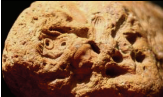
Abb. 2: Ockergelber Hornstein mit Abdruck eines Seeigels ( Tylocidaris oedumi ) von Lüttow, Leg.: K. Deppermann, Ratzeburg, Sammlung: Natureum am Schloss Ludwigslust.