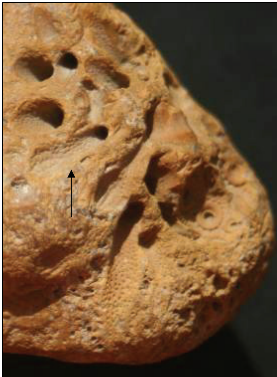
Abb. 3: Ockergelber Hornstein mit Abdruck eines Seeigels ( Tylocidaris oedumi ) von Lüttow. Deutlich ist die Verbreiterung des Stachels zu sehen (Pfeil), Ausschnittbreite 3cm. Leg.: K. Deppermann, Ratzeburg, Sammlung: Natureum am Schloss Ludwigslust.

Teilweise befinden sich Platten der Korona des Seeigels noch im Zusammenhang (Abb. 1-3).