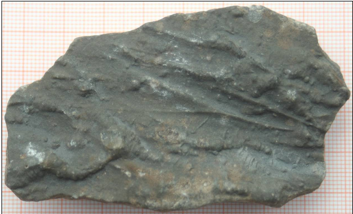
Abb. 3: Neues Exemplar (Paraichnus) von Duvenseeichnus pyramidalis , leg. S. Schneider, Berlin in Kiesgrube Wriezen, 8,5x5,2x2cm, ?Mittelkambrium