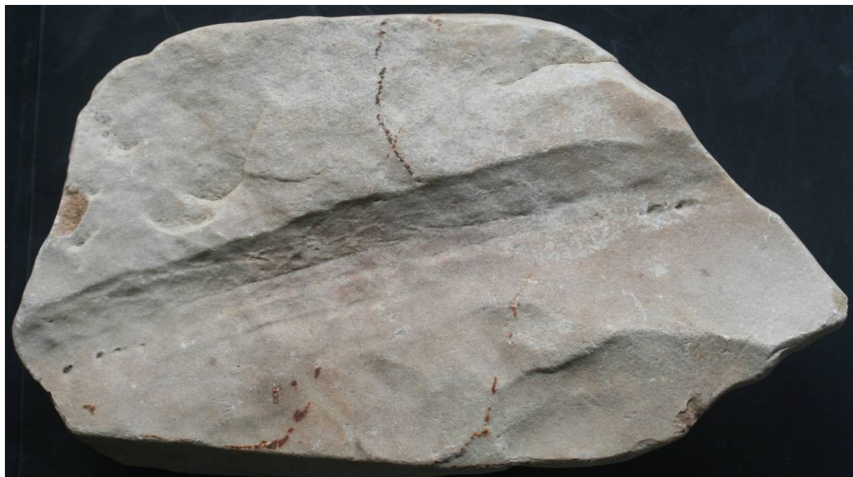
Abb. 1: Fehmarnichnus lierli , Paraichnus aus einem Geschiebe von Barkau, Schleswig-Holstein, Coll. Lierl, Spurbreite 35mm, Abmessungen des Geschiebes 19x11x5cm