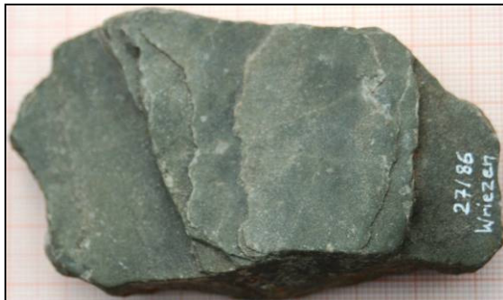
Abb. 4: Rückseite des Exemplars (Paraichnus) mit der Spur von Duvenseeichnus pyramidalis , leg. S. Schneider, Berlin in Kiesgrube Wriezen, 8,5x5,2x2cm, ?Mittelkambrium

Bemerkung: Ob das Spurenfossil aus dem Unter- oder Mittelkambrium stammt, kann derzeit nicht sicher entschieden werden. In der Erstbeschreibung wurde Unterkambrium vermutet, Herr Steffen Schneider, Berlin, mutmaßte für seinen Fund Mittelkambrium, wozu nach Ansicht des Exemplars auch der Verfasser neigt. Die Orientierung der Spuren, beim Holoichnus nahezu identisch, beim Paraichnus ähnlich, aber nicht gleich, könnte mit der Richtung der ehemaligen Strömung im Eingrabbereich zusammenhängen.