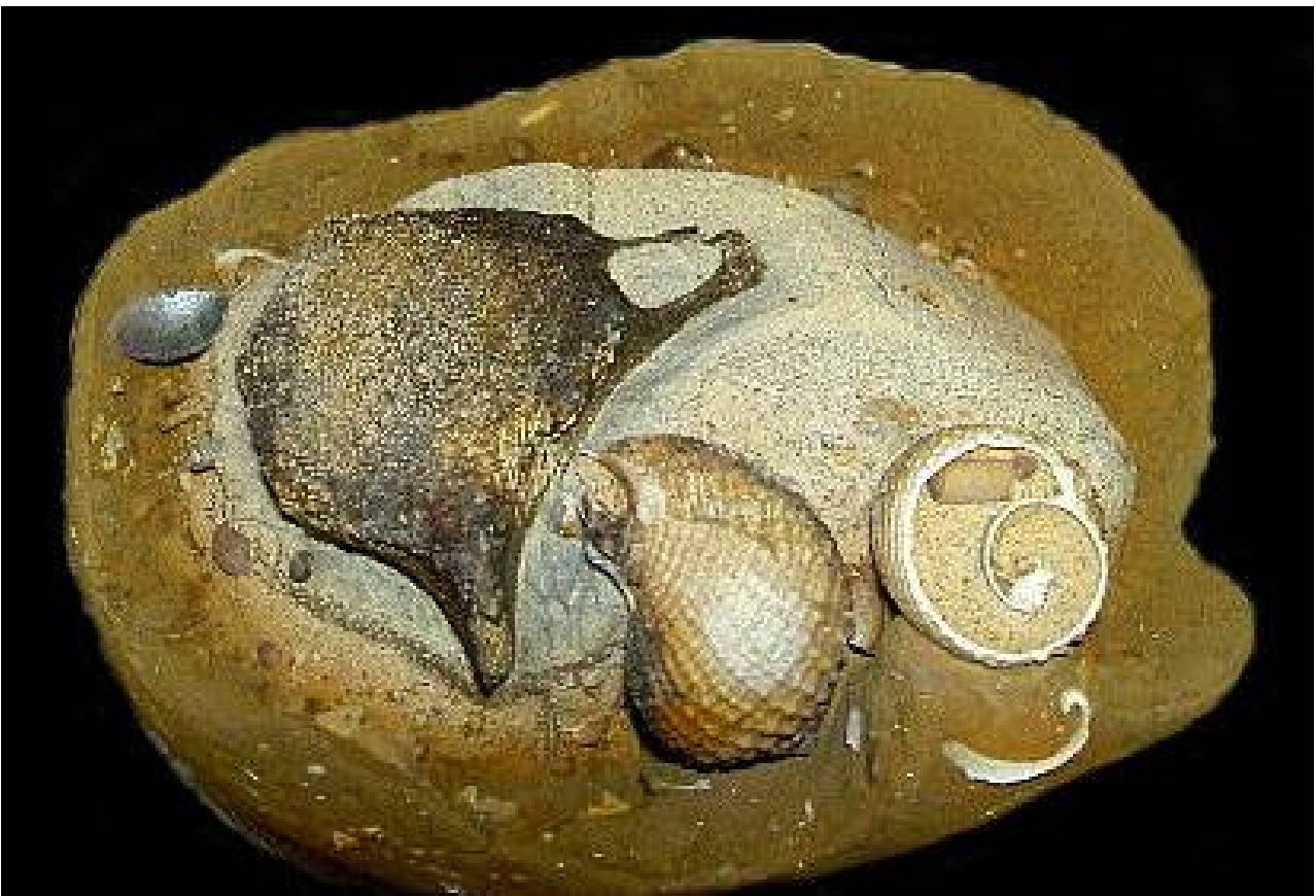
Abb. 4: Wirbel eines Wales aus dem Sternberger Gestein von Kobrow (Sammlung Thiede)

In Deutschland sind diese „haizähnigen Cetacea“ beispielsweise in den oberoligozänen (Chatt) Schichten des Doberges bei Bünde und im oberoligozänen Meeressand von Süchteln und Düsseldorf (Westfalen) nachgewiesen (ROTHAUSEN 1958).