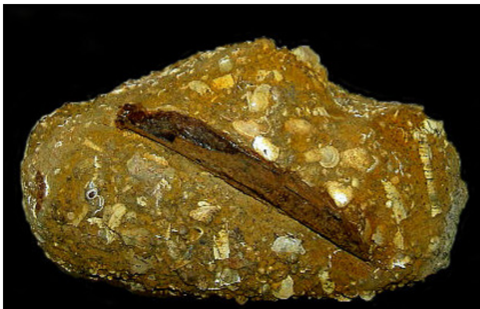
Abb. 5: Ein weiteres Rippenfragment von Walen aus dem Sternberger Gestein von Kobrow (Sammlung Thiede)

Sie gehören vermutlich ebenfalls zu der Gruppe der Zahnwale wie alle bisher beschriebenen Funde aus diesem Geschiebe. Ein Schädelfragment (Sammlung Polkowsky) lässt eventuell nach mündlicher Mitteilung von G. BEHRMANN den Rückschluss auf einen Bartenwal (Mystacoceti) zu. Eine genauere taxonomische Einordnung ist trotz vieler Gemeinsamkeiten fraglich und bleibt nachfolgenden Funden und Untersuchungen überlassen.