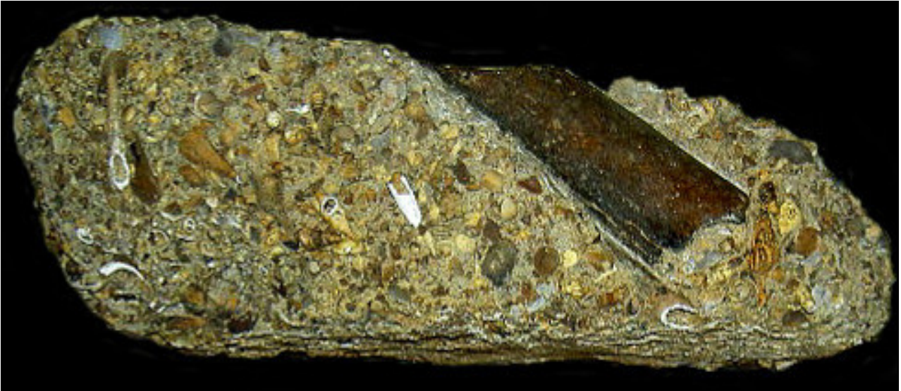
Abb. 3: Ein Rippenfragment eines Wales aus dem Sternberger Gestein von Kobrow (Sammlung Thiede)