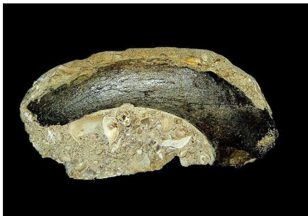
Abb. 1: Rippe eines Zahnwales (Odontoceti) aus dem Sternberger Gestein von Kobrow, Eochattium, Oligozän (Sammlung Thiede)

Das oberoligozäne Sternberger Gestein wird im Volksmund auch „Sternberger Kuchen“ genannt auf Grund seines mandelgebäckähnlichen Aussehens und seiner lokalen Verbreitung im Raum Sternberg, Mecklenburg (JANKE 1999). Es handelt sich dabei um mehr oder weniger braune Kalk- Sandsteinablagerungen mit hellen Molluskeneinschlüssen. Von der Zusammensetzung ausgehend, sind es schluffige Feinsandsteine mit sideritischem oder calcitischem Bindemittel (ENDLER & HERRIG 1995). Auffällig sind verschiedene Farbvarianten, mit zunehmendem Verwitterungsgrad wechselt die Färbung von grau bis dunkelbraun. Der „Sternberger Kuchen“ tritt meist in Form von 10 – 20 cm, seltener auch 30 cm großen, flachen Stücken auf, in denen zahlreiche Fossilien eingeschlossen sind.