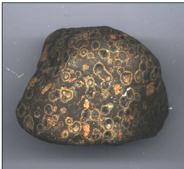
Abb. 1: Der Öje-Diabas-Mandelstein von Poel im unaufgeschnittenen Zustand (Ansicht C), etwa natürliche Größe

Vergleichbare, aber doch deutlich von unserem Stück unterschiedene Mandelsteine sind der Ostsee-Melaphyrmandelstein mit rotvioletter Grundmasse (Abb. 8.36 bei SCHULZ, 2003 und Abb. S. 66 bei RUDOLPH, 2005) und der Ostseediabas-Mandelstein, die man etwas häufiger auch auf der Insel Poel gefunden hat.