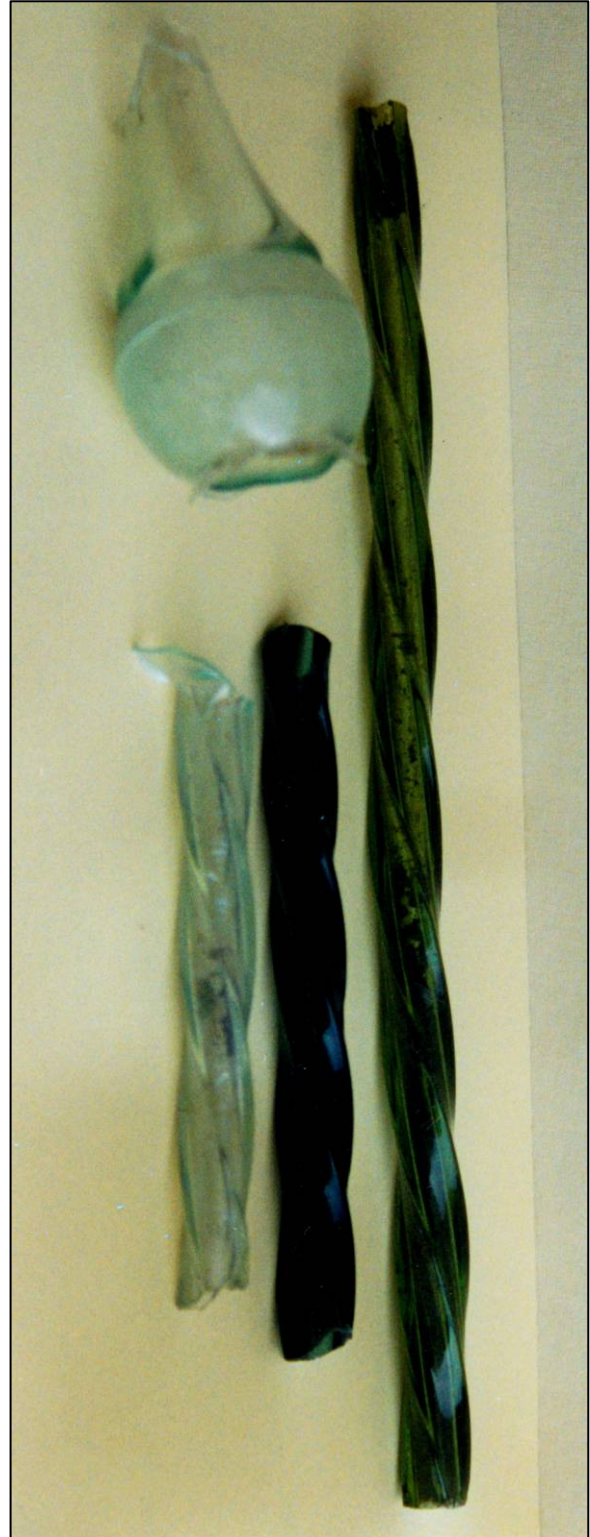
Abb. 2: Vier Bruchstücke eines Blumenstabes in den Farben weiß, blau und grün.

Gedrehte, viereckige Hohlglasstäbe in den Farben grün, blau und weiß sind im Fundgut vom Hüttenplatz Alt-Schwerin nicht selten. Einmal befand sich der Rest einer Kugel am Glasstab. Der Fund einer Glaskugel mit aufgesetzter Spitze, wenn auch beschädigt, regte zu oben stehender Rekonstruktion an (siehe Abb.1) und entspricht damit der obigen Beschreibung.