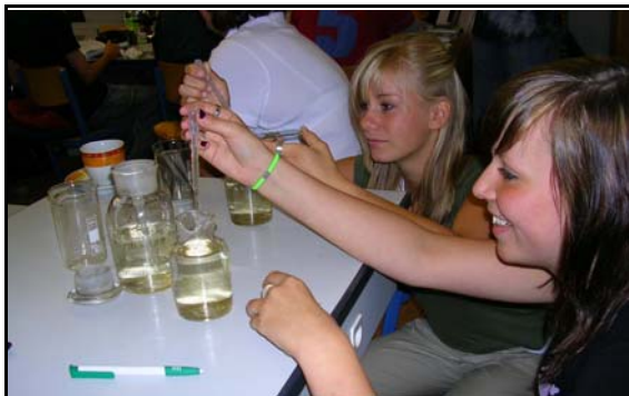
Abb. 11: Schüler der Lenné-Schule (Klasse 8b) Ludwigslust beim Experimentieren

Das museumspädagogische Angebot wurde zunehmend von den Schulen der Region genutzt. Insgesamt besuchten 50 Gruppen (960 Kinder bzw. Schüler) das Natureum, um hier Projekttag zu erleben. Im Mittelpunkt standen die Pflanzen und Tiere des Schlossparks, die meist bei Exkursionen beobachtet wurden. Substratproben aus den Teichen sowie vom Waldboden wurden interessiert unter dem Mikroskop betrachtet. Andere Themen waren z.B. die Tiere im Teich, der Sternberger Kuchen bzw. allgemein Fossilien, Boden und Bodentiere oder die Bäume und Sträucher im Park. Die Schulklassen kamen zum überwiegenden Teil aus Ludwigslust und der Region: Grabow, Kummer, Techentin, Schwerin, Wittenförden, Boizenburg und Dömitz. Die Verteilung der Schul- und Bildungseinrichtungen im Vergleich zum Vorjahr geht aus der folgenden Tabelle hervor.