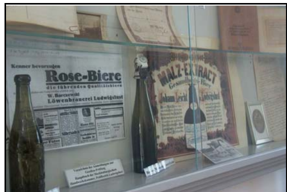
Abb. 5: Ansicht der Sonderausstellung zur Geschichte des Handwerks in Ludwigslust

Die geplante Sonderausstellung zum „Überlebenskampf der Naturvölker der Welt“ konnte aus Krankheitsgründen nicht im Oktober realisiert werden und musste auf Anfang 2009 verschoben werden.