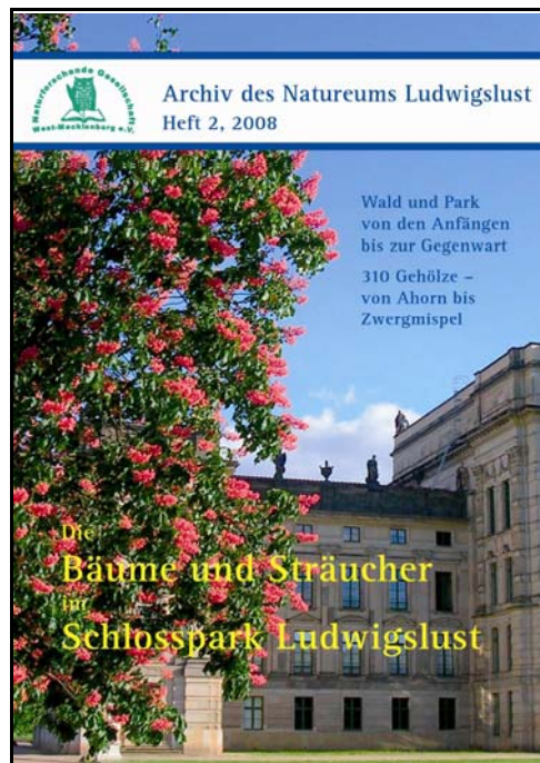
Abb. 13: Archiv des Natureums, Heft 2

Das jährliche Heft der „Mitteilungen der Naturforschenden Gesellschaft West-Mecklenburg“ konnte bis zum Jahresende erstellt und verschickt werden.