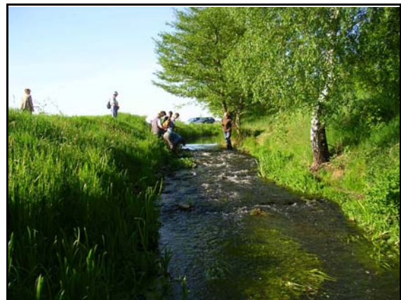
Abb. 2: Botanik-Fachgruppe des Landkreises Ludwigslust am Kraaker Mühlenbach