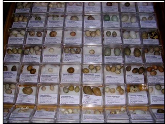
Abb. 7: Teil der überarbeiteten und inventarisierten Eiersammlung

Für das Jahr 2009 ist die komplette Inventarisierung der Wirbeltier-Belege sowie ausgewählter Gruppen der Wirbellosen vorgesehen.