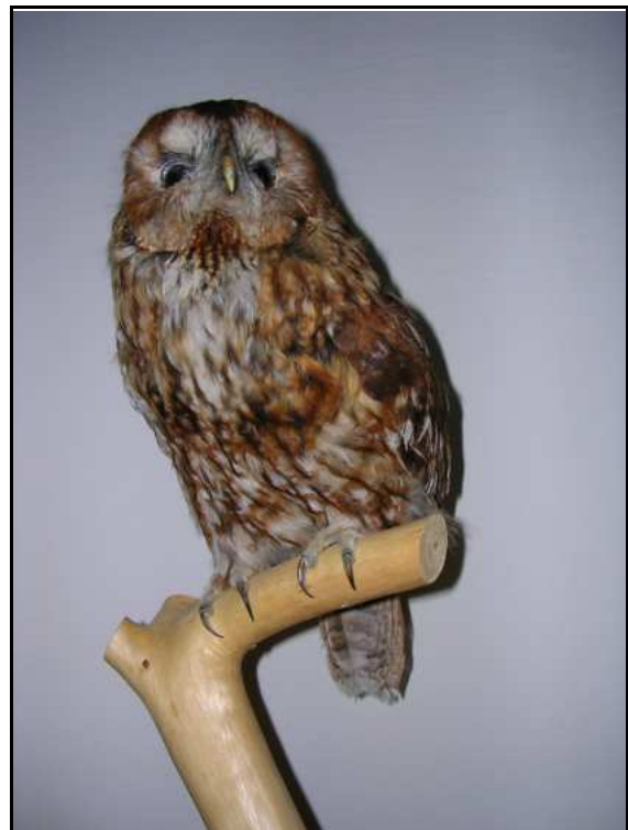
Abb. 9: Waldkauz aus dem Schlosspark Ludwigslust, Präparation von C. Weinberg gespendet

Im Berichtszeitraum wurden drei Arbeitseinsätze organisiert, um die Sauberkeit und Attraktivität des Museums beizubehalten.