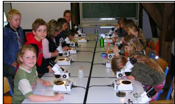
Abb. 12: Grabower Grundschüler beim Mikroskopieren

2008 wurde die Kartierung der Pflanzen, Pilze und Tiere im LSG „Schlosspark Ludwigslust“ mit der Erstellung und Einsendung der Manuskripte beendet. Leider verzögerte sich letztere bis zum September, sodass die Formatierung und der Druck bis März 2009 abgewickelt werden müssen.