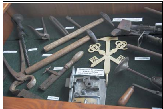
Abb. 4: Ansicht der Sonderausstellung zur Geschichte des Handwerks in Ludwigslust