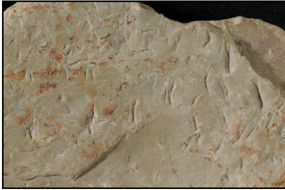
Abb. 13: Detailaufnahme von Fund 1 von D. Schmälze, Oberseite mit den Spuren von D. juchemi . Sammlung Schmälze, Lesesteinhaufen nahe Bad Freienwalde.