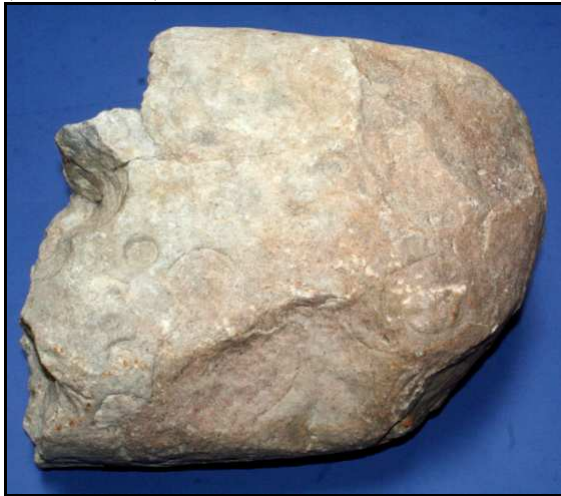
Abb. 33: Unterseite des Geschiebes mit Bergaueria lagingi n. ichnog. et ichnosp., Ackerfund von Gifkendorf (warthestadial), Unterkambrium