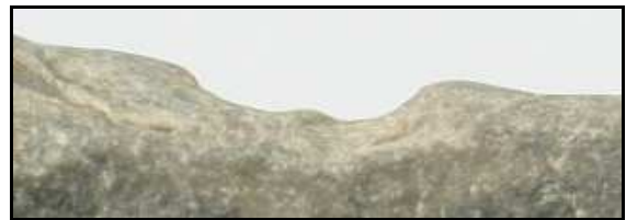
Abb. 20: Querschnitt vom Holoichnus von Psammichnites pittermanni n. ichnosp., Klein Klütz Höved, Nordwestmecklenburg, Deutschland

Beschreibung Paraichnus: Das Gesteinsstück ( Abb. 23, 24 ), auf dem sich die Spur befindet, stammt vom Hochufer bei Groß Klütz Höved, Nordwestmecklenburg, Deutschland, Größe: 8 \times 6 \times 2,6 \text{ cm} , leg.: W. Zessin