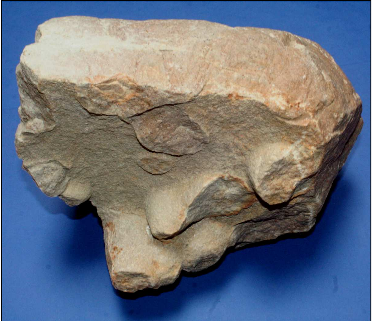
Abb. 27: Geschiebe mit Bergaueria lagingi n. ichnog. et ichnosp., Ackerfund von Gifkendorf (warthestadial), Unterkambrium