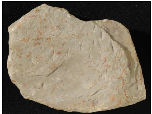
Abb. 11: Fund 1 von D. Schmälze, Oberseite mit den Spuren von D. juchemi , Sammlung Schmälze, Lesesteinhaufen nahe Bad Freienwalde.