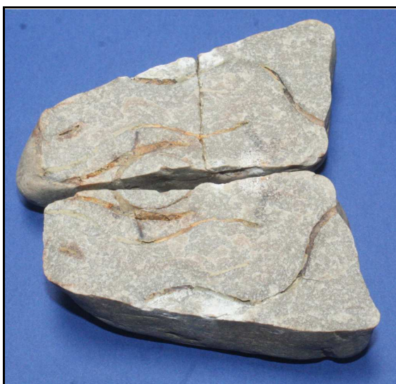
Abb. 26: Cochlichnus karlae n. ichnosp., Holoichnus, SZ UK 48/1 und 48/2, Größe im unaufgeschlagenen Zustand: 83x40x35mm, Warlow, Landkreis Ludwigslust, Deutschland

Material: Es liegt nur der Holoichnus vor.