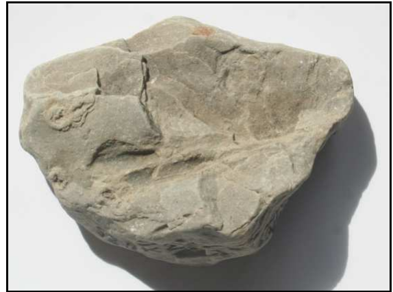
Abb. 23: Paraichnus von Psammichnites pittermanni n. ichnosp., Groß Klütz Höved, Nordwestmecklenburg, Deutschland, Größe: 8x6x2,6cm, leg.: W. Zessin