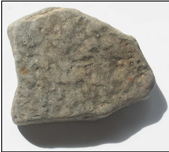
Abb. 21: Rückseite vom Holoichnus von Psammichnites pittermanni n. ichnosp., Klein Klütz Höved, Nordwestmecklenburg, Deutschland, Größe: 9x7x3cm, leg.: D. Pittermann, Zittow