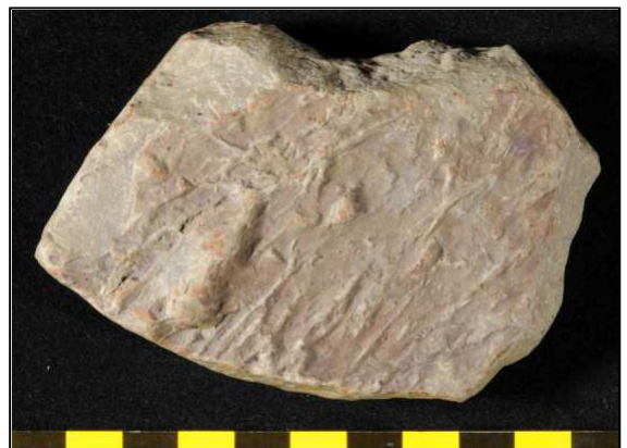
Abb. 12: Fund 1 von D. Schmälze, Unterseite mit den Eophyton-Spuren, Sammlung Schmälze, Lesesteinhaufen nahe Bad Freienwalde