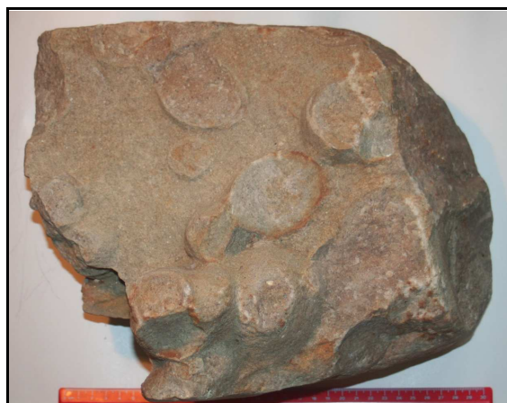
Abb. 29: Oberseite von dem Geschiebe mit Bergaueria lagingi n. ichnog. et ichnosp., Ackerfund von Gifkendorf (warthestadial), Unterkambrium, Maßstab: 30cm

Beschreibung: Das Geschiebe mit den Spurenfossilien ist 34cm lang, 30cm breit und 11cm dick (ohne die erhabenen Kegelstümpfe der Spurenfossilien). Die Färbung des Quarzits ist hell fleischfarben bis weißlich. Die Quarzkörner, soweit erkennbar, sind feinsandig, unter 1mm Korngröße. Auch auf der anderen Seite der Gesteinsplatte kann man einige Querschnitte dieses Spurenfossils