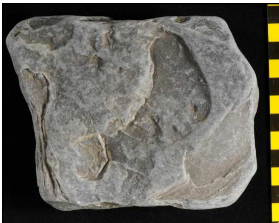
Abb. 15: Fund 2 von D. Schmälze, Unterseite, Sammlung Schmälze, Mön, Dänemark.

Wie wichtig solche Vorträge sind, zeigt die Antwort von Herrn Dr. Hoffmann vom 4.2.2009: „Anbei schicke ich Ihnen drei Bilder meines Fundes vom Hochufer am letzten Wochenende in Boltenhagen. Ohne Ihren Vortrag hätte ich mir die abgerollten Spuren des Eophyton-Sandsteines wahrscheinlich nicht so genau angeschaut. Ich werde diesem Gestein jetzt mit besonderem Interesse nachstellen!“ (Abb. 6-8)