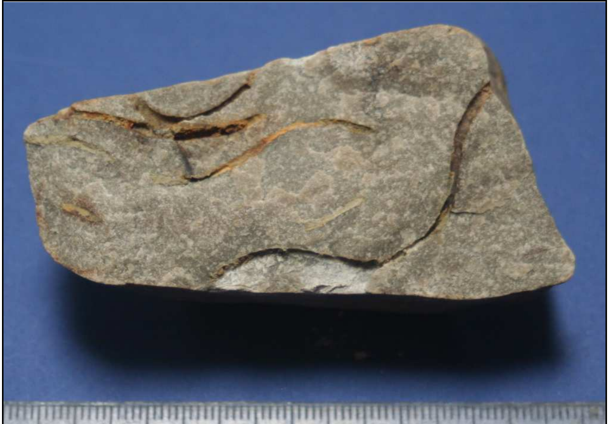
Abb. 25: Cochlichnus karlae n. ichnosp., Holoichnus, SZ UK 48/1, Größe: 83x40x20mm, Warlow, Landkreis Ludwigslust, Deutschland

Diagnose: Sehr regelmäßige, kleine, im Querschnitt runde Spurenart der Gattung mit einer Spurenbreite von ca. 1mm bei einer Amplitudenlänge der sinusförmigen Spur von etwa 40mm.