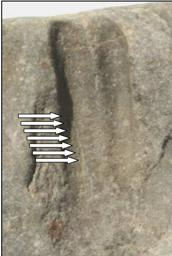
Abb. 22: Vergrößerung des Ausschnittes (Ausschnittbreite 2,5cm) mit der neuen Spur Psammichnites pittermanni n. ichnosp., Klein Klütz Höved. Die Pfeile zeigen die besser erkennbaren Querrippen an.