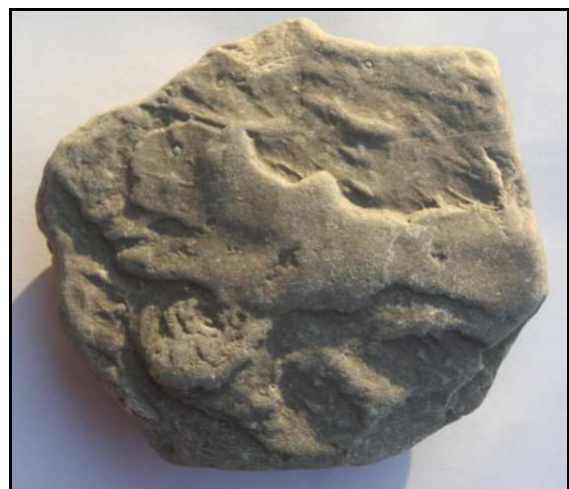
Abb. 2: Unterseite des Fundes von Uwe-Michael Troppenz, Parchim, Eophyton-Spuren, Foto: Uwe-Michael Troppenz, Parchim