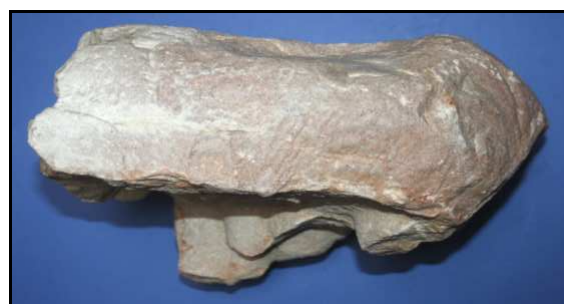
Abb. 30: Seitenansicht 1 von dem Geschiebe mit Bergaueria lagingi n. ichnog. et ichnosp., Ackerfund von Gifkendorf (warthestadial), Unterkambrium