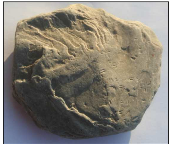
Abb. 1: Fund von Lürschau, leg. Uwe-Michael Troppenz, Parchim, Oberseite mit Spuren von Dimorphichnus juchemi , Größe: 9x8,5x2cm

Von diesem Spurenfossil sind inzwischen einige weitere Exemplare in Kiesgruben, am Ostseestrand (Groß und Klein Klütz-Höved) bzw. in den alten Sammlungsbeständen gefunden worden, die wir nachfolgend bekannt machen. Bereits auf dieser Tagung zeigte mir Herr Uwe-Michael Troppenz aus Parchim ein weiteres Stück mit dieser seltenen Spur, das er bereits 1989 bei Lürschau gefunden hatte (Slg. Troppenz LÜ1/89, Abb. 1, 2 und 3 ). Die Abdrücke der Laufbeine sind hier nicht alle in gleicher Richtung.