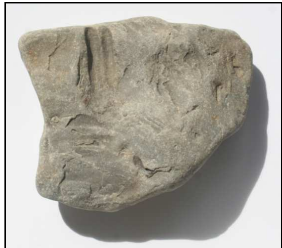
Abb. 19: Holoichnus von Psammichnites pittermanni n. ichnosp., Klein Klütz Höved, Nordwestmecklenburg, Deutschland, Größe: 9 \times 7 \times 3 \text{ cm} , leg.: D. Pittermann, Zittow

Beschreibung Holoichnus: Das Gesteinsstück, auf dem sich die Spur befindet, ist 9 \times 7 \text{ cm}^2 groß und an der dicksten Stelle 3cm. Die Einzelspur ist ca. 10mm breit und 30mm lang. Die Abstände der flachen Querriefen zueinander betragen im Mittel etwa 1mm. Im Querschnitt ähnelt die Spur einem flachen W ( Abb. 20 ).