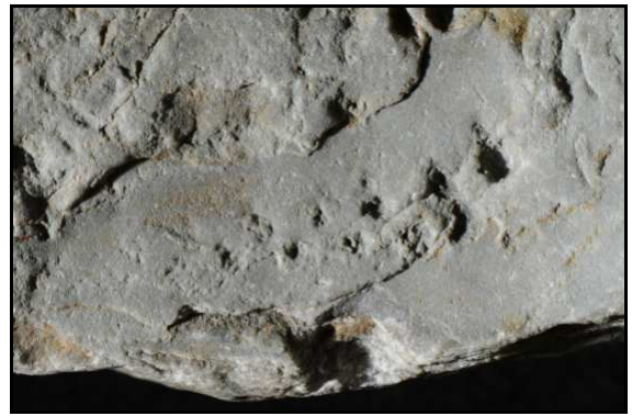
Abb. 10: Detailaufnahme vom Fund vom Hochufer bei Boltenhagen von Dr. René Hoffmann, Oberseite mit den Spuren von D. juchemi , Sammlungsnummer uKEophyt 002. Rechts oben erkennt man deutlich die typische Spur von D. juchemi . Erhaltungsbedingt sind die weiteren Abdrücke (Mitte) undeutlich in ihren Einzelheiten zu erkennen.