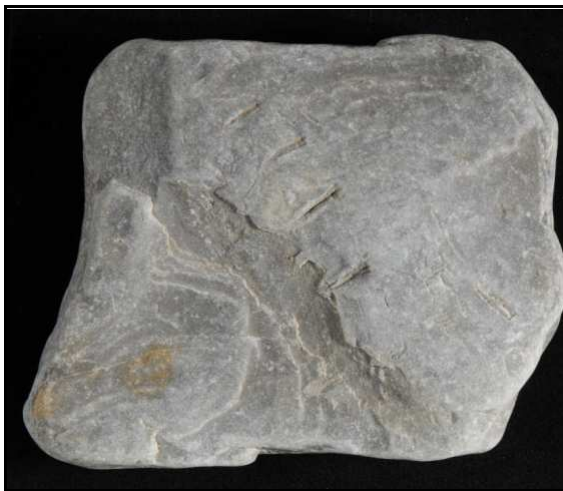
Abb. 14: Fund 2 von D. Schmälze, Oberseite mit den Spuren von D. juchemi , Sammlung Schmälze, Mön, Dänemark.