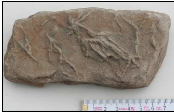
Abb. 18: Trockenrissausfüllungen bei einem unterkambrischen Eophytonsandstein, leg. G. Stamer, 23898 Wentorf