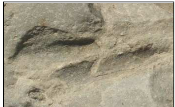
Abb. 24: Vergrößerung der Spur des Paraichnus von Psammichnites pittermanni n. ichnosp., Groß Klütz Höved, Bildbreite 3,7cm