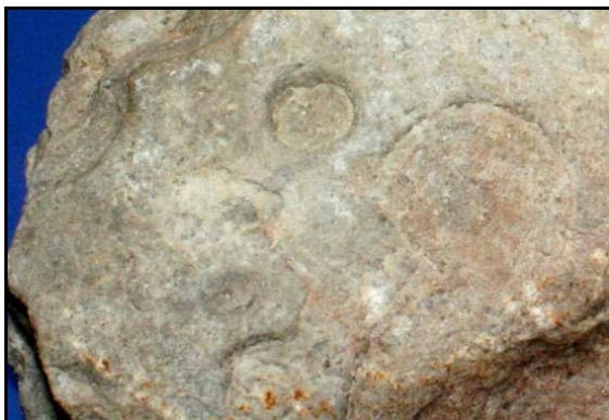
Abb. 34: Unterseite des Geschiebes mit Bergaueria lagingi n. ichnog. et ichnosp., Ackerfund von Gifkendorf (warthestadial), Unterkambrium