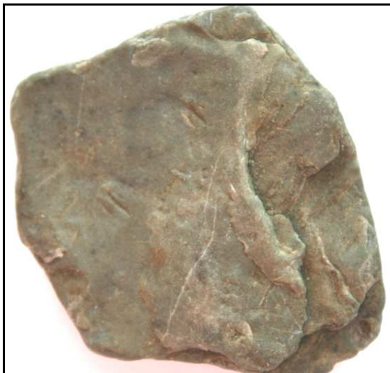
Abb. 4: Fund von Ronald Klafack, Rostock, Sammlungsnummer: SKMK27, 5,0x4,5x1,0cm, Oberseite mit der Spur D. juchemi , Fundort: Markgrafenheide, 1985.

Herr Klafack schrieb mir dazu: „Mein Stück mit der Trilobitenfährte kann man zwar nicht zwingend Deiner neuen Ichnotaxa zuordnen. Der Halbmondbogen der 3. Krallen ist nicht eindeutig genug ausgebildet. Dafür zeigt sie aber einiges mehr, und zwar entweder die Abdrücke der Spitzen