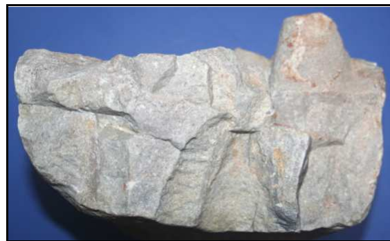
Abb. 31: Seitenansicht 2 von dem Geschiebe mit Bergaueria lagingi n. ichnog. et ichnosp., Ackerfund von Gifkendorf (warthestadial), Unterkambrium