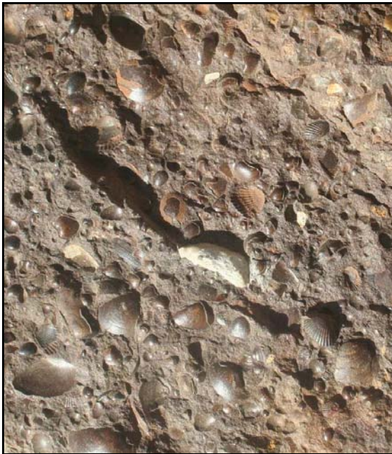
Abb. 40: Rückseite der Wellenrippl-Platte (Abb. 39), Gerölle (Quarz) mit teilweise mehr als 1cm Durchmesser (Bildmitte) und ebenso wie die Wellenrippeln auf ufernahe Bereiche schließen lassen, Foto: W. Zessin