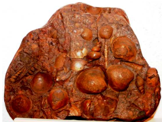
Abb. 45: Rabensteinfelder Turrillengestein, Raben Steinfeld, 25x20x5cm, leg. 1980, Slg. Braasch, Raben Steinfeld