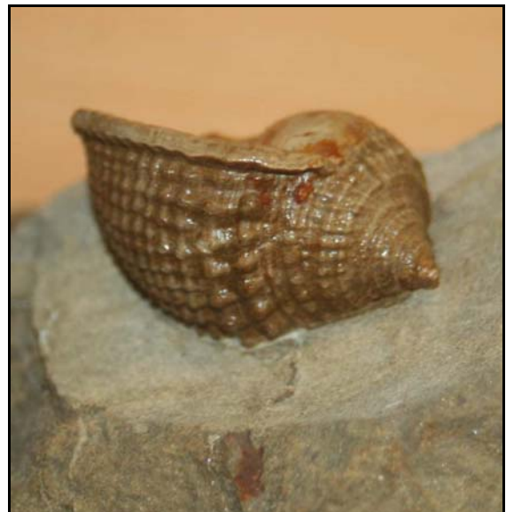
Abb. 20: Helmschnecke ( Phalium rondeleti ) aus dem Conrader Gestein, 5cm lang, Conrade, leg. Polkowsky, Slg. K. und N. Thiede, Parchim, Foto: W. Zessin