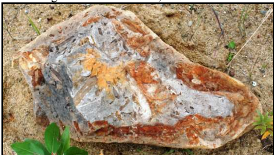
Abb. 5: Conrader Gestein mit großem Holzrest, Durchmesser 30cm, Conrade