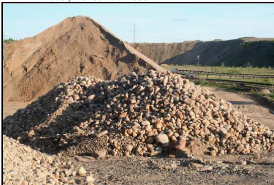
Abb. 3: Typuslokalität des „Conrader Gesteins“, Kiesgrube Conrade, ca. 10km westlich Schwerin im Mai 2009