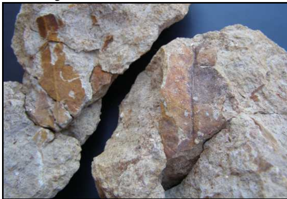
Abb. 28: Conrader Gestein mit Laubblatt (Myrtengewächse, Myrtaceae), Blattgröße: 15cm lang, 3cm breit, Conrade, Sammlung K. und N. Thiede, Parchim, Foto: K. Thiede

Die hier vorgestellten drei Beispiele (Abb. 26-28) sind in vielen Jahren Sammeltätigkeit die einzigen Exemplare geblieben.