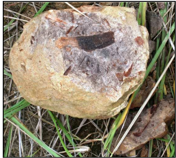
Abb. 6: Conrader Gestein mit großem Holzrest, Durchmesser 25cm, Conrade

An der Typuslokalität haben die Conrader Gesteine Durchmesser von ca. 20-40cm, eine gelblich-braune Verwitterungsrinde und im Kern eine grau-blaue Färbung (siehe Abb. 4-6). Nach POLKOWSKY (2005) unterscheidet sich die Dekapodenfauna des Conrader Gesteins beträchtlich von der des Sternberger Gesteins. Sie ist bisher unbearbeitet, soll jedoch individuen- und artenreicher und in der Zusammensetzung verschieden von der des Sternberger Gesteins sein. Allein von Coeloma credneri konnte Polkowsky 30 Carapace, gefunden in Conrade, Pinnow, Ventschow, Pinnow-Ausbau und Plate, vermelden!