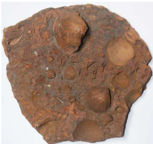
Abb. 35: Rabensteinfelder Turritellengestein, Raben Steinfeld, Länge 30cm, leg. 1980, Slg. Dr. Zessin, Jasnitz, Sammlungsnummer SZ OIR 3, Foto: W. Zessin