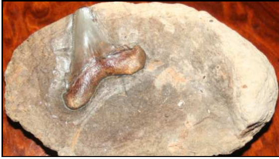
Abb. 8: Haizahn ( Carcharocles angustidens. ) im Conrader Gestein, Conrade, Zahnlänge 6cm, leg.: Polkowsky, Slg.: K. & N. Thiede, Parchim