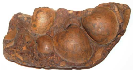
Abb. 34: Rabensteinfelder Turritellengestein, Raben Steinfeld, 22x10x6cm, leg. 1980, Slg. Braasch, Raben Steinfeld, Foto: W. Zessin