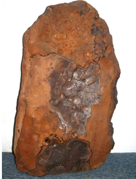
Abb. 37: Rabensteinfelder Turritellengestein, Pinnow, 87x50x18cm, leg. 1985, Slg. Braasch, Raben Steinfeld