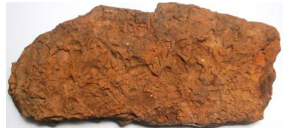
Abb. 31: Rabensteinfelder Turritellengestein, Rückseite des Exemplars von Abb. 29, Raben Steinfeld, Länge 30cm, leg. 1980, Slg. Dr. Zessin, Jasnitz, Sammlungsnummer SZ OIR 2, Foto: W. Zessin

Differenz-Diagnose: Im Gegensatz zum „Sternberger Gestein“ oder „Sternberger Kuchen“ in seiner typischen Ausprägung enthält das „Rabensteinfelder Turritellengestein“ gehäuft große Schnecken ( Turritella cf. venus ) und Muscheln, zumeist eingeregelt. Auch handelt es sich bei diesem Gesteinstyp nicht um Zusammenschwemmungen in der Brandungszone bzw. um Tempestite. Die Gesamtfauuna scheint artenärmer zu sein.