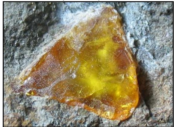
Abb. 7: Bernstein im Conrader Gestein, Bernsteindurchmesser 10mm, Conrade, leg.