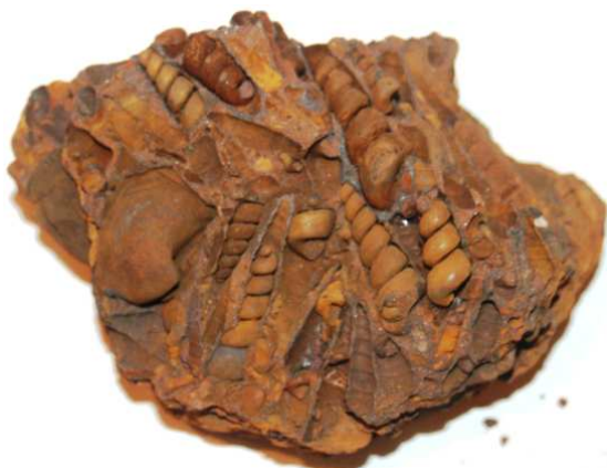
Abb. 42: Rabensteinfelder Turrillengestein, Raben Steinfeld, 13x9x7cm, leg. 1980, Slg. Braasch, Raben Steinfeld, Foto: W. Zessin