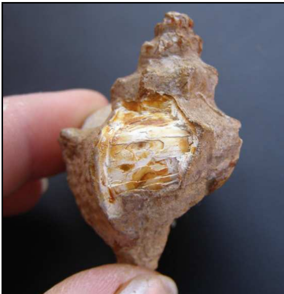
Abb. 22: Conrader Gestein mit Schnecke ( Boreotrophon cf. deshayesii , 4,5cm lang), Conrade, Sammlung K. und N. Thiede, Parchim, Foto: K. Thiede