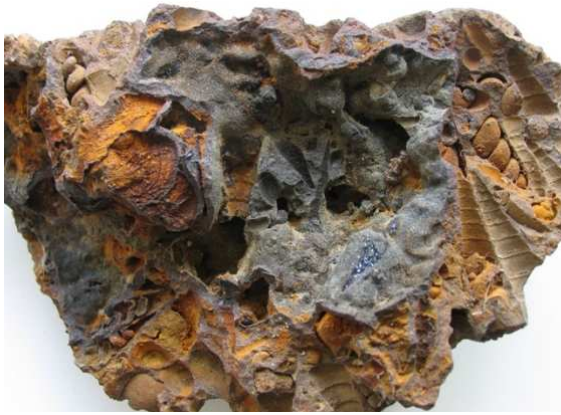
Abb. 33: Rabensteinfelder Turritellengestein, Consrade, Rückseite des Exemplars von Abb. 32, Länge 20cm, leg., Slg. und Foto: S. Polkowsky

Bemerkungen: Bisher sind uns noch keine Stücke dieses Gesteinstyps bekannt geworden, die die Mollusken mit unaufgelösten Schalen enthalten. Die hier vorgestellten Exemplare stammen alle aus den oberflächennahen Bereichen um Raben Steinfeld, Consrade und Pinnow. Die großen Exemplare wurden zum Teil in den Baugruben der Häuser 1980 in Raben Steinfeld, Unterdorf, gefunden. Eine Faunenbearbeitung steht noch aus.