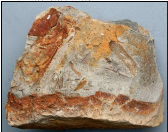
Abb. 4: Conrader Gestein mit Holzresten, Größe: 30x23x17cm, Typusexemplar für das Gestein, Conrade, Sammlung Dr. Zessin, Jasnitz, Sammlungsnummer SZ OIC 1, Foto: W. Zessin