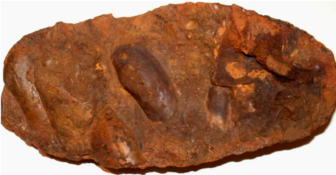
Abb. 46: Rabensteinfelder Turritellengestein, Steckmuschel links unten Atrina cf. pectinata , Mitte Panopea angusta , rechts oben Säuger-Wirbelknochen, 34x16x10cm, leg. 1980, Slg. Braasch, Raben Steinfeld