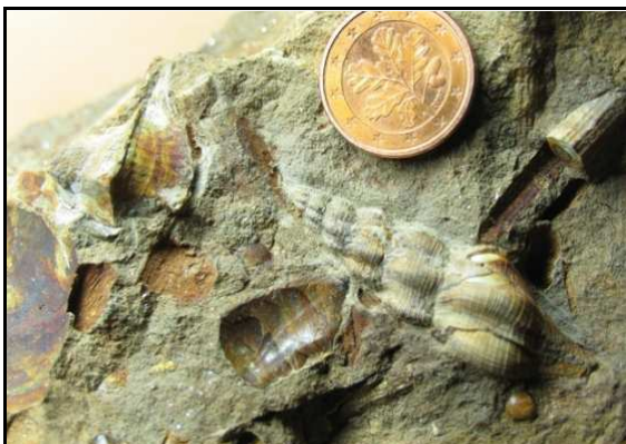
Abb. 17: Mollusken (rechts Pterynotus brevicauda ) im Conrader Gestein, Conrade, Sammlung Pierre Schröder (Münstermaifeld), leg., und Foto: S. Polkowsky

Muscheln, Schnecken und Dentalien sind häufig und teilweise in sehr guter Erhaltung zu finden.