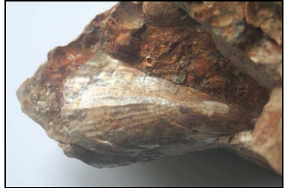
Abb. 18: Steckmuschel ( Atrina cf. pectinata ) aus dem Conrader Gestein, 7cm lang, Conrade, leg., Slg. K. und N. Thiede, Parchim, Foto: W. Zessin