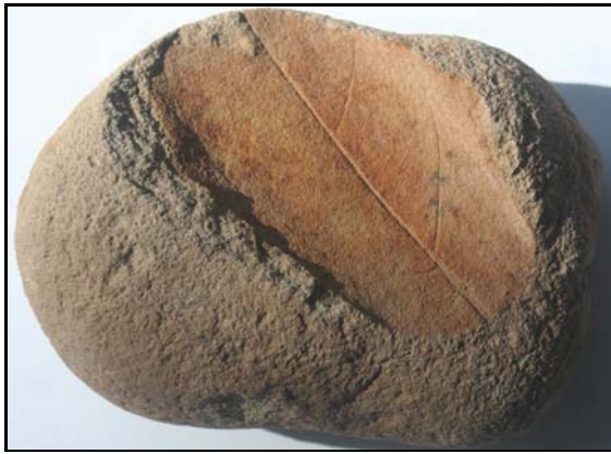
Abb. 27: (?) Conrader Gestein mit Laubblatt (Familie Myrtengewächse, Myrtaceae), Gesteinsgröße: 10x7x4cm, leg. 7.5.1995, Weitendorf, Sammlung Dr. Zessin, Jasnitz, Sammlungsnummer SZ OIC 12, Foto: W. Zessin