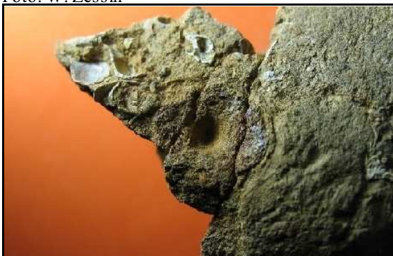
Abb. 10: Fischwirbel im Conrader Gestein, Conrade, Durchmesser des Wirbels 18mm, leg., Slg. und Foto: S. Polkowsky