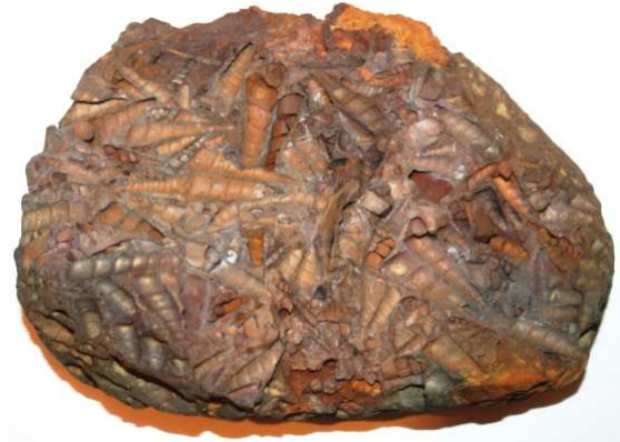
Abb. 43: Rabensteinfelder Turrillengestein, Raben Steinfeld, 20x15x8cm, leg. 1980, Slg. Braasch, Raben Steinfeld, Foto: W. Zessin