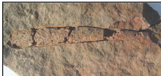
Abb. 38: Rabensteinfelder Turritellengestein (14x9x2cm) mit Knochenfragment 8cm lang (Fischflossentachel), Raben Steinfeld, leg. 1980, Slg. Braasch, Raben Steinfeld, Foto: W. Zessin