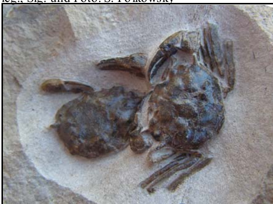
Abb. 11: Coeloma (Paracoeloma) credneri , Ausschnittbreite: 7,5cm, Conrade 2009, leg. S. Polkowsky, Slg. und Foto: K. Thiede