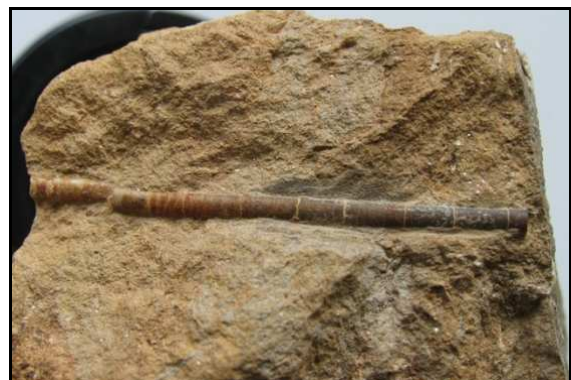
Abb. 14: Seefeder (ca. 5cm lang, Octocorallia) im Conrader Gestein, Conrade, leg., Slg. und Foto: S. Polkowsky

Von REICH & SCHNEIDER (2002) wurde der erste Octocorallia-Rest aus dem Sternberger Gestein publiziert. Eine Publikation des hier abgebildeten Exemplars (Abb. 14) und eines weiteren in der Sammlung von K. und N. Thiede, Parchim, steht noch aus.