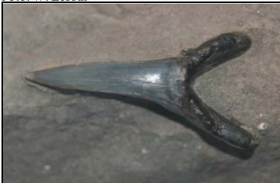
Abb. 9: Haizahn ( Carcharias cuspidatus ) im Conrader Gestein, Conrade, Zahnlänge 4cm, leg.: Polkowsky, Slg.: K. & N. Thiede, Parchim