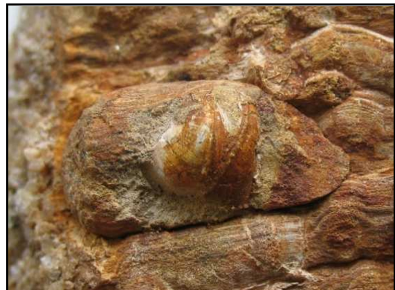
Abb. 19: Bohrmuschel ( Teredo sp.) im Conrader Gestein, Länge 6mm, Conrade, leg., Slg. und Foto: S. Polkowsky

Muscheln, Schnecken und Dentalien sind häufig und teilweise in sehr guter Erhaltung zu finden.