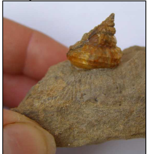
Abb. 25: Conrader Gestein mit Schnecke ( Bathybembix cf. pustolosa , 1,5cm hoch), die bisher nur aus den Fundstellen vom Doberg, von Glimmerode, um Hannover und aus Sollingen bei Braunschweig bekannt ist. Conrade, Sammlung K. und N. Thiede, Parchim

Pflanzenreste in Form von Häcksel, auch mal größere Holzstücke, sind häufig, gut erhaltene Blattreste jedoch ausgesprochen selten.