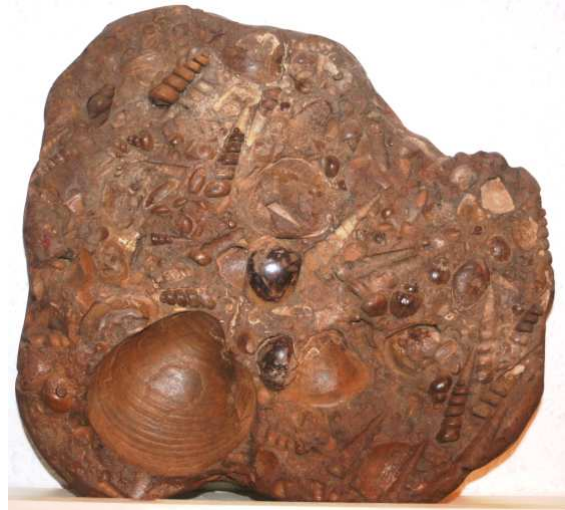
Abb. 36: Rabensteinfelder Turritellengestein, Raben Steinfeld, 30x30x5cm, leg. 1980, Slg. Braasch, Raben Steinfeld, Foto: W. Zessin

Bemerkungen: Bisher sind uns noch keine Stücke dieses Gesteinstyps bekannt geworden, die die Mollusken mit unaufgelösten Schalen enthalten. Die hier vorgestellten Exemplare stammen alle aus den oberflächennahen Bereichen um Raben Steinfeld, Consrade und Pinnow. Die großen Exemplare wurden zum Teil in den Baugruben der Häuser 1980 in Raben Steinfeld, Unterdorf, gefunden. Eine Faunenbearbeitung steht noch aus.