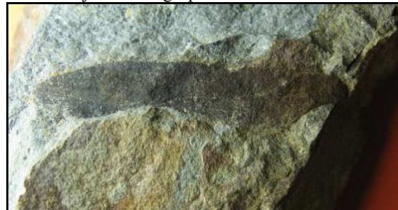
Abb. 26: Pflanzenfrucht (ahornartig) im Conrader Gestein, Länge der Frucht 53mm, Conrade, leg., Slg. und Foto: S. Polkowsky

Pflanzenreste in Form von Häcksel, auch mal größere Holzstücke, sind häufig, gut erhaltene Blattreste jedoch ausgesprochen selten.