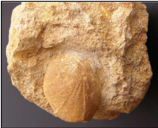
Abb. 16: Conrader Gestein mit Seeigel ( Spatangus sp.), Maße: 1,7 x 1,4 cm, Conrade, leg. S. Polkowsky, Sammlung K. und N. Thiede, Parchim, Foto: K. Thiede