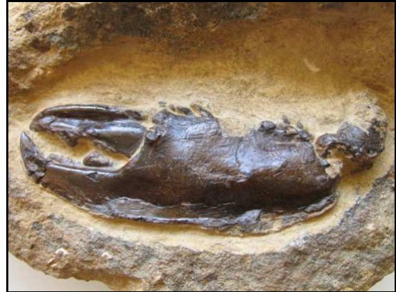
Abb. 12 Homarus (Homarus?) neptunianus POLKOWSKY, 2005, Länge: 7,5 cm, Fundort: Plate 2009, leg., Slg. und Foto: S. Polkowsky