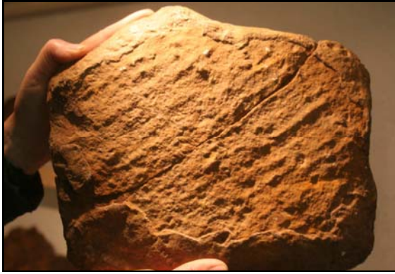
Abb. 39: Rabensteinfelder Turrillengestein,, 30x25x5cm, Wellenrippeln, leg. 1980 und Slg. R. Braasch, Raben Steinfeld