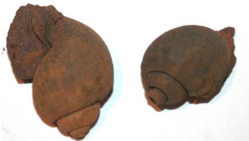
Abb. 41: Rabensteinfelder Turritellengestein, Raben Steinfeld, Helmschnecken-Steinkerne ( Phalium cf. rondeleti ), Höhe 4,5 und 4cm, leg. 1980, Slg. Braasch, Raben Steinfeld