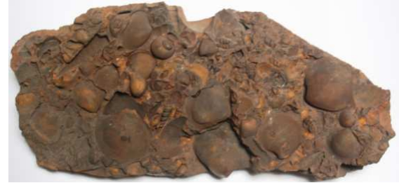
Abb. 30: Rabensteinfelder Turritellengestein, Raben Steinfeld, Länge 30cm, leg. 1980, Slg. Dr. Zessin, Jasnitz, Sammlungsnummer SZ OIR 2, Foto: W. Zessin

Locus typicus: Raben Steinfeld, Unterdorf, ca. 10km südlich von Schwerin