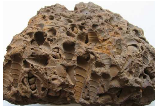
Abb. 32: Rabensteinfelder Turritellengestein, Conrade, Länge 20cm, leg., Slg. und Foto: S. Polkowsky