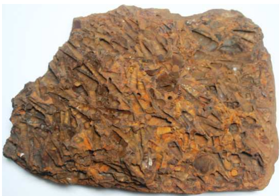
Abb. 29: Rabensteinfelder Turritellengestein, Raben Steinfeld, Länge 30cm, Typusexemplar für den Gesteinstyp, leg. 1980, Slg. Dr. Zessin, Jasnitz, Sammlungsnummer SZ OIR 1

Typusexemplar: Sammlung Dr. Zessin, Jasnitz, Sammlungsnummer SZ OIR 1 (Abb. 29), später Natureum am Schloss Ludwigslust