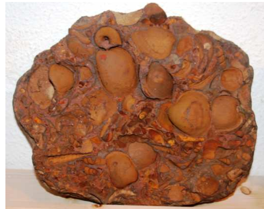
Abb. 44: Rabensteinfelder Turrillengestein, Raben Steinfeld, 30x23x5cm, leg. 1980, Slg. Braasch, Raben Steinfeld, Foto: W. Zessin