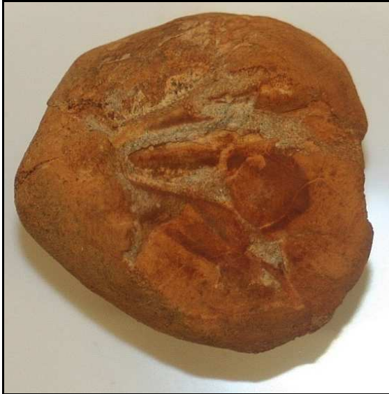
Abb. 15: Seeigel ( Schizaster acuminatus ) aus dem Conrader Gestein, Pinnow, leg. Polkowsky, Slg. K. und N. Thiede, Foto: W. Zessin