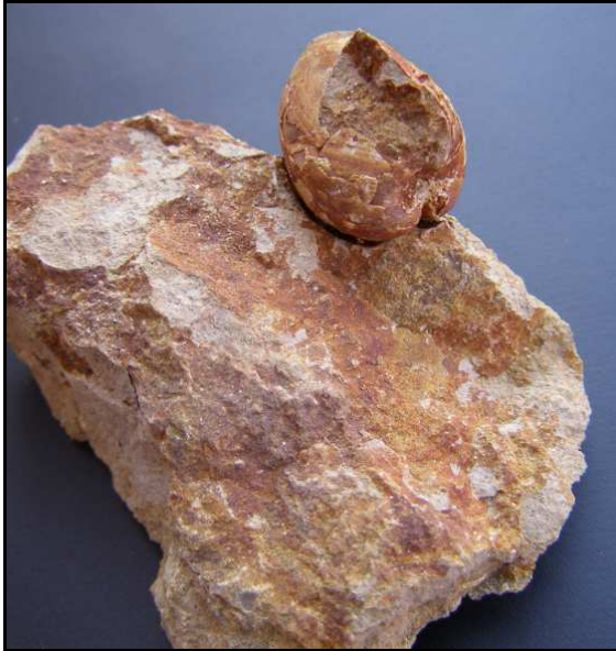
Abb. 21: Conrader Gestein mit doppelklappiger Muschel, Muscheldurchmesser: 2,5cm, Conrade, Sammlung K. und N. Thiede, Parchim, Foto: K. Thiede