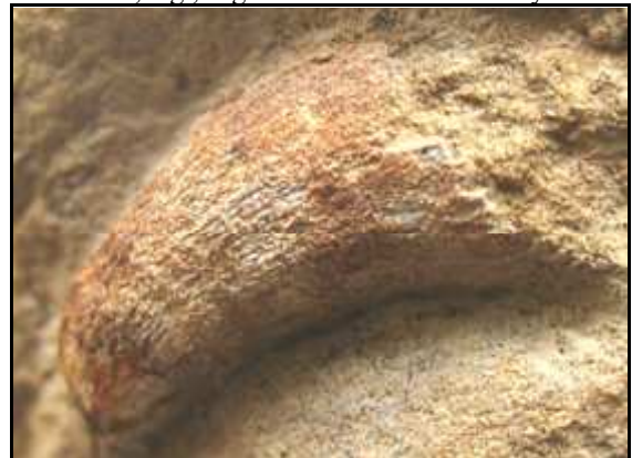
Abb. 13: Eine von zehn Korallen ( Caryophyllia cf. granulata ) aus dem Conrader Gestein, Länge 16mm, Conrade, leg., Slg. und Foto: S. Polkowsky

Von REICH & SCHNEIDER (2002) wurde der erste Octocorallia-Rest aus dem Sternberger Gestein publiziert. Eine Publikation des hier abgebildeten Exemplars (Abb. 14) und eines weiteren in der Sammlung von K. und N. Thiede, Parchim, steht noch aus.