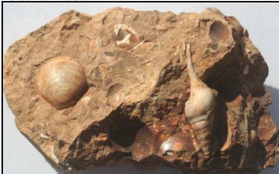
Abb. 23: Conrader Gestein (8cm lang), Pinnow, Sammlung R. Braasch, Raben Steinfeld