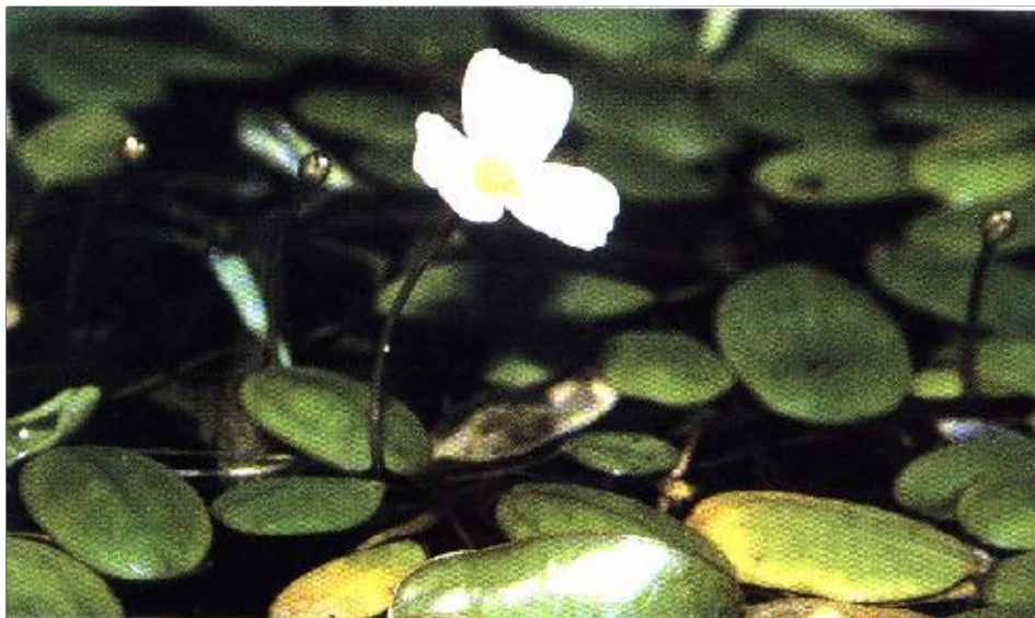
Abb. 1: Luronium natans (Schwimmendes Froschkraut) im Waldtümpel am Griemoor. Foto: H. MIETHE, 1998

Das Schwimmende Froschkraut ( Luronium natans ) ist die einzige Art der Gattung Luronium . Sie wird der Familie der Froschlöffelgewächse ( Alismataceae ) zugeordnet. Luronium natans bildet als vielgestaltige Pflanze Land- und Wasserformen mit unterschiedlichen Blättern aus. Die ausdauernde Pflanze besitzt ein kurzes, aufrechtes Rhizom, hat ganzjährig grüne Rosetten, bildet Ausläufer und im Herbst zur Verbreitung sowie Überwinterung Turionen (Hibernakeln). Pflanzen, die in tieferem Wasser wurzeln, sind oft steril. Bei den auffällig weiß blühenden Exemplaren wird Selbstbefruchtung als typisch angesehen. Die atlantische Gesamtverbreitung von Luronium natans erstreckt sich von Frankreich und Großbritannien bis zum nördlichen Mitteleuropa. Das Vorkommen in Mecklenburg-Vorpommern liegt am nordöstlichen Arealrand. Im gesamten Verbreitungsgebiet ist die Art inzwischen selten bis sehr selten geworden, regional oft schon fehlend. Infolgedessen wurde sie in den Anhang der FFH-Richtlinie aufgenommen