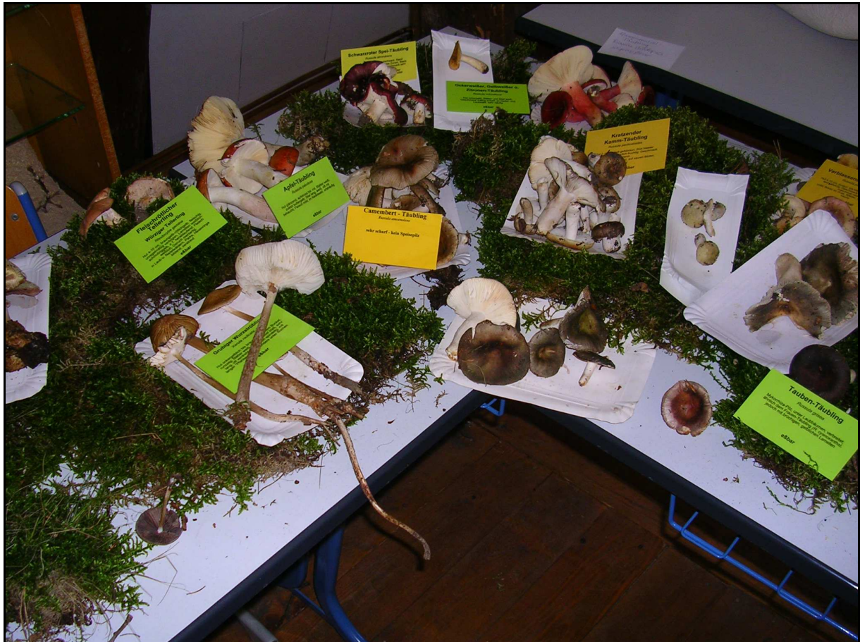
Abb. 3: Teil der umfangreichen Pilzausstellung