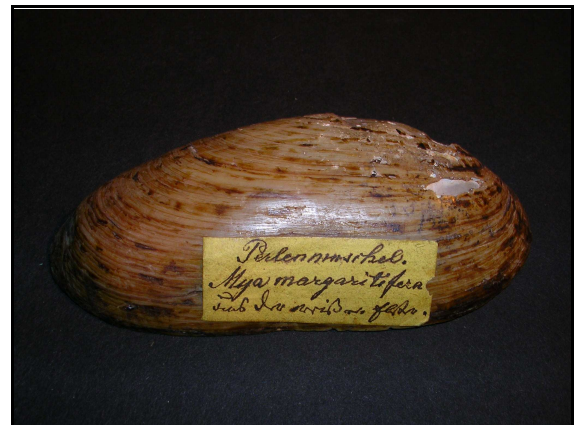
Abb. 5: Flussperlmuschel aus der Sammlung Krille; Weiße Elster, vor 1940

Pilze (119) und 1 Flechte. An dieser Stelle sei ein herzlicher Dank an U. Schlüter und H. Sluschny (Schwerin) gerichtet, die fast alle botanischen Belege der Sammlungen Krille und Rehbein im Natureum unter hohem Zeiteinsatz revidierten.