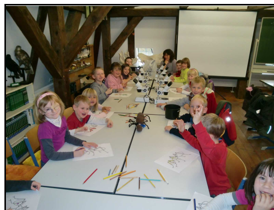
Abb. 7: Kinder der Kita Gillhoff Ludwigslust lernen mit der „Forscherameise Fred“.