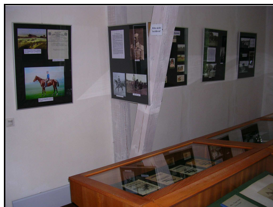
Abb. 2: Teil der Sonderausstellung „Reitsport in der Kavalleriegarnison Ludwigslust“