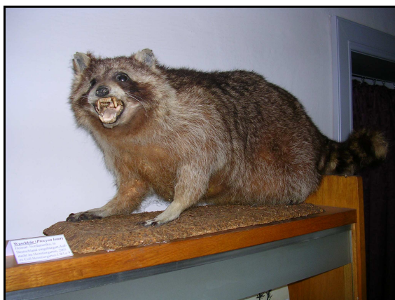
Abb. 4: Waschbär aus der ehemaligen Sammlung des Ludwigsluster Heimtiergarten e.V.

Einige neue Präparate wurden dem Natureum für die Dauerausstellung bzw. die Sammlung übergeben, so einige Ganzpräparate von Säugetieren und Vögeln vom Ludwigsluster Heimtiergarten e.V. (H. Knötel), der sich 2010 auflöste und von R. Ottmann (Tuckhude).