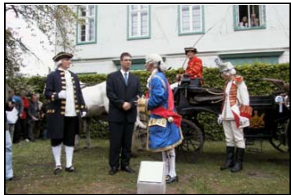
Abb. 8: Feierliche Schlüsselübergabe am 21.05.2006