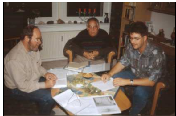
Abb. 1: Erste Vorstandssitzung im Jahr 2000