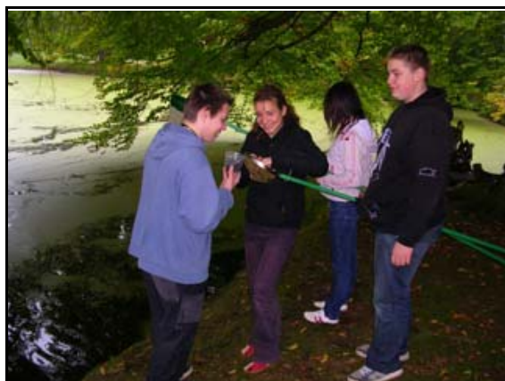
Abb. 30: Schüler einer 10. Klasse bei der Abschlussexcursion zur Ökologie, 2008