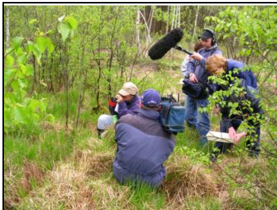
Abb. 28: 1. Kartierungstreffen im LSG „Schlosspark Ludwigslust“ mit dem NDR-Fernsehen, 2005