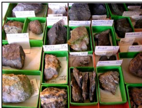
Abb. 24: Teil der geologischen Sammlung

Wichtig war dabei das vielfältige Angebot an Themen, das die Arbeitsgebiete der Mitglieder des Vereins und seiner Sympathisanten widerspiegelt.