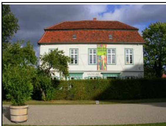
Abb. 6: Fontänenhaus nach der Sanierung im BUGA-Jahr 2009