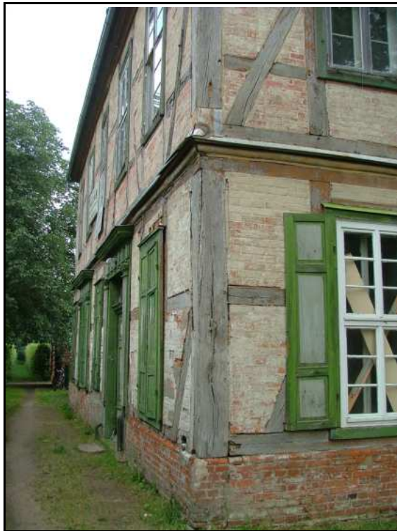
Abb. 4: Fontänenhaus vor der Sanierung 2002