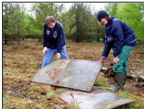
Abb. 31: Mitglieder der ehemaligen Jugendgruppe bei Untersuchungen zur Herpetofauna an der TAV Ludwigslust – Fundort der Kreuzkröte, 2004