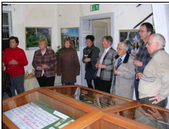
Abb. 21: Eröffnung der Sonderausstellung „Ureinwohner der Welt ...“ 2009

Folgende Sonderausstellungen konnten bisher gezeigt werden: