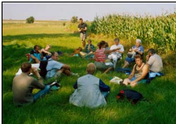
Abb. 27: Frühstückspause während einer Tagesexkursion zur Insel Poel, 2003