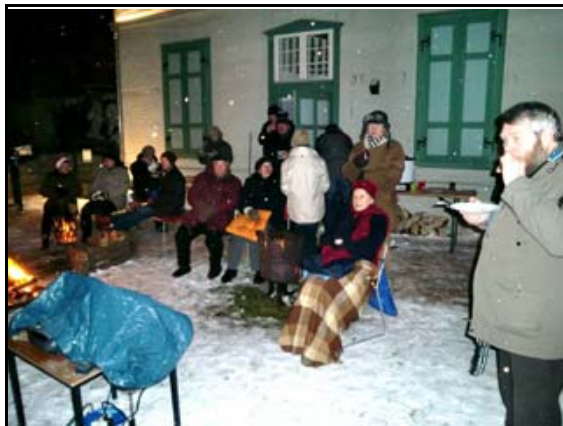
Abb. 13: Wintergrillen der NGM mit dem BarockLust e.V.