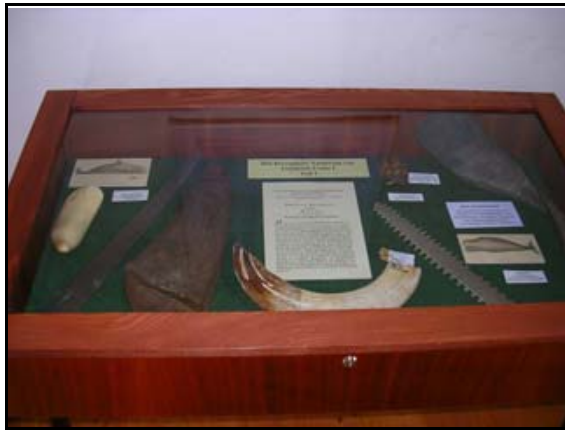
Abb. 20: Die erste Sonderausstellung – die herzogliche Naturaliensammlung von Friedrich Franz I., 2006