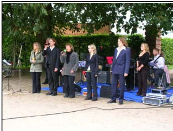
Abb. 38: Das Liedtheater LIVE bei einem Benefizkonzert, 2007