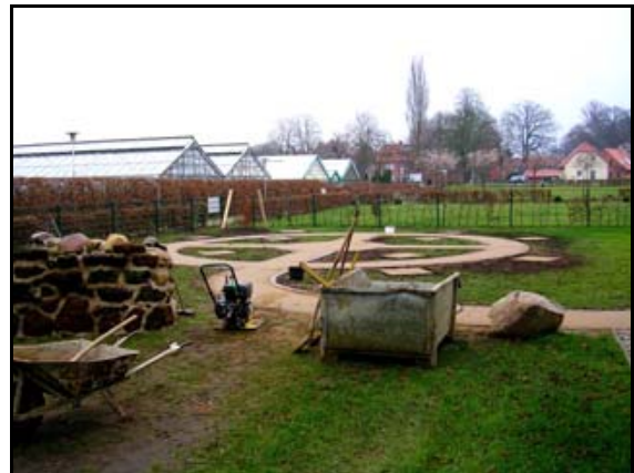
Abb. 19: Der Geschiebegarten entsteht, 2006/2007