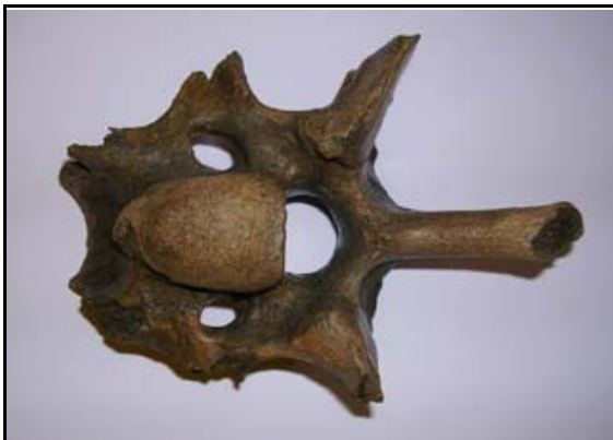
Abb. 16: Wirbelknochen eines Riesenhirsches, Kiesgrube Zweedorf