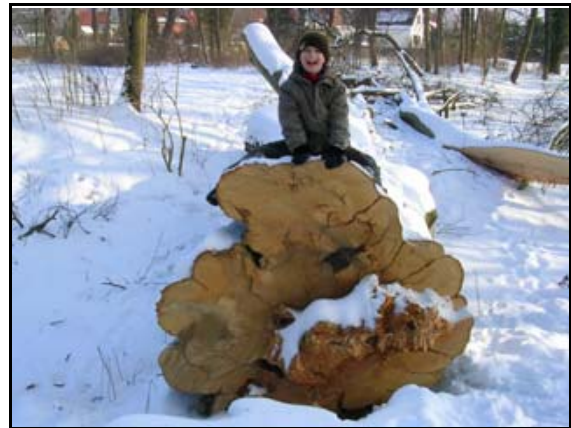
Abb. 36: 2010 gefällter potenzieller Brutbaum des Eremiten ( Osmoderma eremita )

Population vor. Die quantitative Untersuchung 2009 ergab für das nur 264 m 2 große Seggenried eine Gesamtpopulationszahl von 10.824 Individuen bei einer mittleren Besiedlungsdichte von 41 Individuen/m 2 .