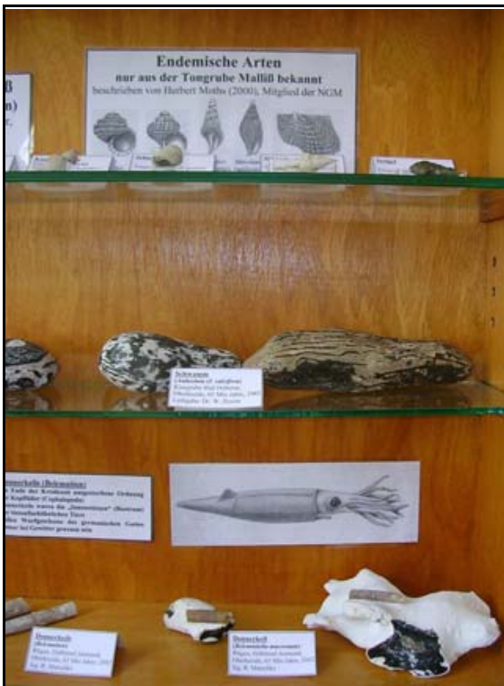
Abb. 15: Blick in eine Vitrine des Geologie/Paläontologie-Raumes