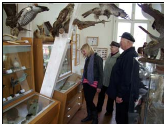
Abb. 10: Besucher im Natureum

* Zählung ab 22.05.2006 (Eröffnung am 21.05.2006)