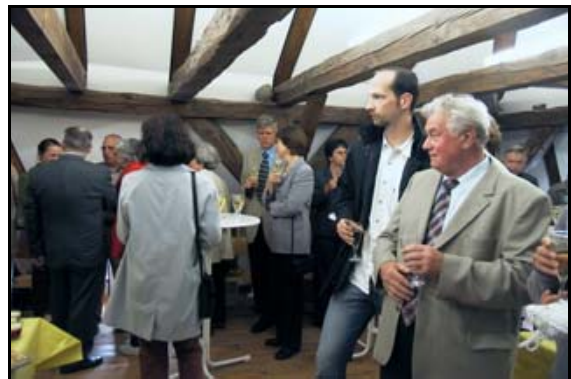
Abb. 9: Gäste im Natureum am Eröffnungstag, Foto: S. Böttcher