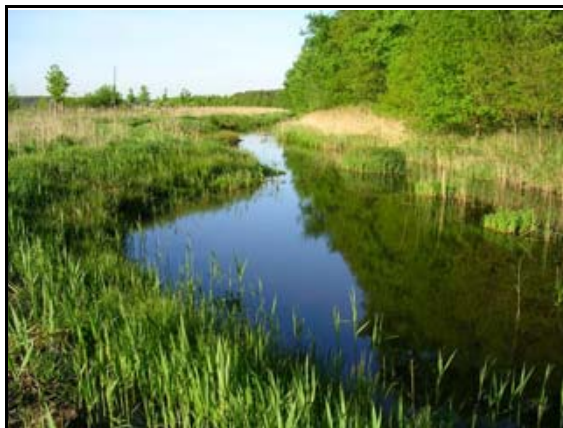
Abb. 35: Renaturierter Abschnitt des Kraaker Mühlenbaches

ausgewählten Gruppen bei Pflanzen und Tieren führten die NGM (U. Jueg, H. Sluschny, U. Schlüter, B. Schurig, Botanik-Fachgruppe des Landkreises Ludwigslust, U. Binner) und der Entomologische Verein Mecklenburg e.V. (U. Deutschmann, Dr. W. Zessin, R. Ludwig, A. Schuster) durch. Die Ergebnisse der bisher abgeschlossenen Erfassungen zu den Insekten wurden bereits im Virgo – Mitteilungsblatt des Entomologischen Vereins Mecklenburg 2010 publiziert, die Ergebnisse zu den Erfassungen der Pflanzen, Weichtiere und Egel 2010 in JUEG et al. (2010), darunter 24 Arten der Roten Listen von Mecklenburg-Vorpommern. Weitere Endberichte sollen demnächst folgen.