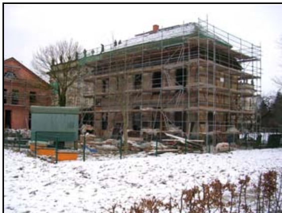
Abb. 5: Fontänenhaus während der Sanierung 2005