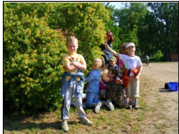
Abb. 29: Kinder untersuchen die Insekten im Perückenstrauch, 2006

Die Schulklassen, die Projektstage im Natureum gestalten, kommen zum überwiegenden Teil aus Ludwigslust, aber auch aus der Umgebung, z.B. Boizenburg, Schwerin, Parchim. Von Juni 2006 bis Dezember 2010 waren 174 Gruppen (2.916 Kinder/Schüler) Gast im Natureum.