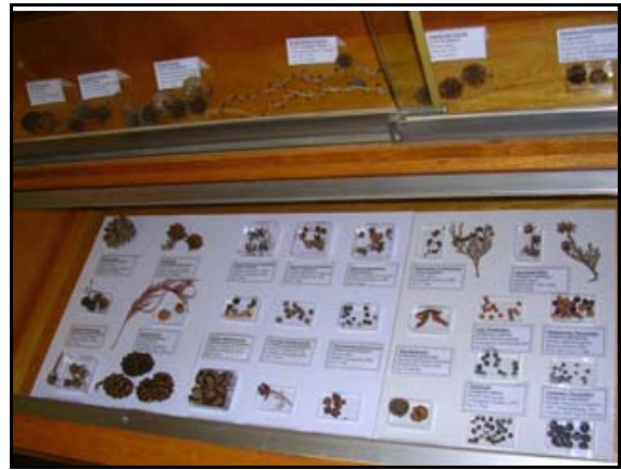
Abb. 17: Blick in die Zapfensammlung