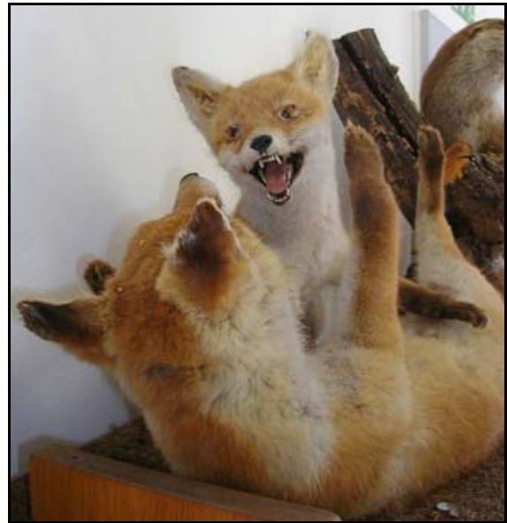
Abb. 18: Spielende Jungfüchse, Schenkung des Ludwigsluster Heimtiergarten e.V.