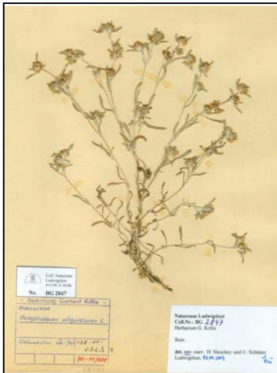
Abb. 22: Gnaphalium uliginosum (Sumpfruhrkraut) aus der Sammlung Krille