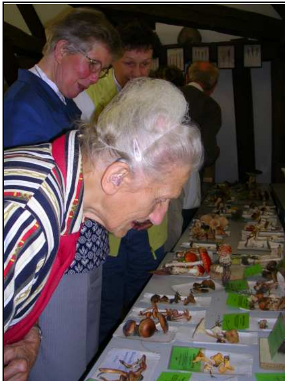
Abb. 26: „Pilzabend“ – ein immer gut besuchter Museumsabend, 2009