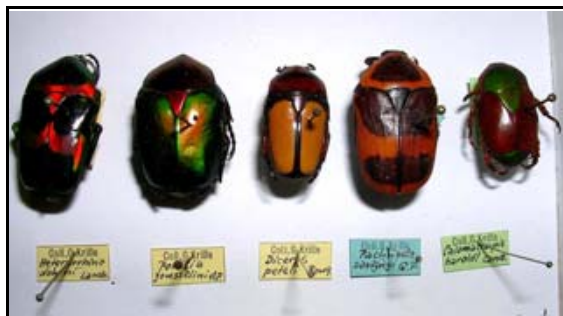
Abb. 23: tropische Käfer aus der Sammlung Krille