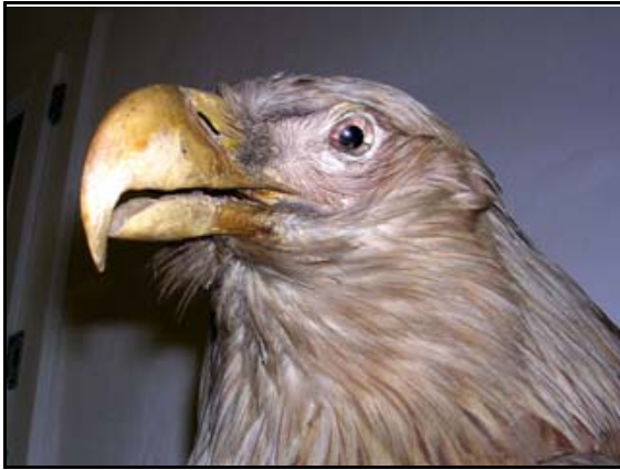
Abb. 14: Seeadler, Schenkung der Naturschutzstation Lewitz-Fischteiche an die NGM