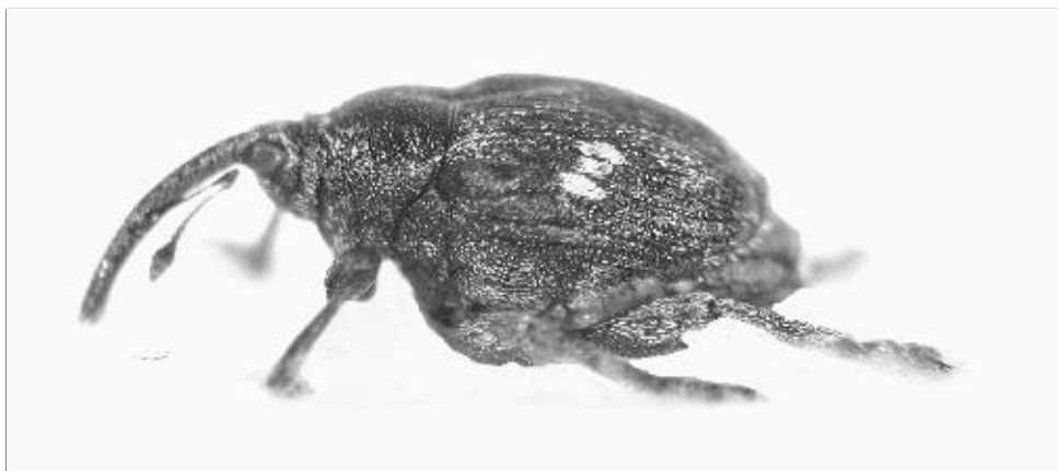
Abb. 1 und 2: Mogulones trisignatus , ein stenotoper Besiedler von Xerothermstandorten